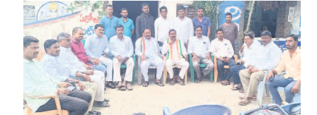
పండించిన ధాన్యానికి మద్దతు ధరతో పాటు, రూ 5 వందల బోనస్ అందిస్తూ అన్నదాతల కళ్ళల్లో ఆనందాన్ని నింపిందన్నారు. కాంగ్రెస్ పార్టీ అధికారం చేపట్టి సంవత్సరం పూర్తయిన సందర్భంలో ప్రజా పాలనలో అనేక సంక్షేమ పథకాలను అమలు చేసినంబరాలు జరుపుకుంటుందన్నారు. గతంలో కాంగ్రెస్ పార్టీ మహిళల సంక్షేమం కోసం ఎంతో కృషి చేసిందని పేర్కొన్నారు. మండలంలోని కాంగ్రెస్ పార్టీ మాజీ

ఈనెల నాల్గు న పెద్దపల్లిలో కాంగ్రెస్ పార్టీ నిర్వహిస్తున్న విజయోత్సవ సభను మండలంలోని కాంగ్రెస్ కార్యకర్తలు కలిసికట్టుగా పనిచేసి విజయవంతం చేయాలని కాల్య శ్రీరాంపూర్ మాజీ ఎంపీపీ గోపగోని సారయ్య గౌడ్, మాజీ జెడ్పీటీసీ లంక నడయ్య లు అన్నారు. ఆదివారం కాల్య శ్రీరాంపూర్ మండల కేంద్రంలో నిర్వహించిన ముఖ్య కార్యకర్తల సమావేశంలో పలువురు నాయకులతోపాటు వారు మాట్లాడుతూ మాట తప్పని పార్టీ కాంగ్రెస్ పార్టీ అని, ఇచ్చిన మాట ప్రకారం యువతకు ఉద్యోగాలు కల్పించి, రుణ మాఫీ చేసిన ఘనత ముఖ్యమంత్రి రేవంత్ రెడ్డి కాంగ్రెస్ పార్టీకే దక్కిందన్నారు. రైతులు