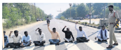
డాక్టర్ బాబాసాహెబ్ అంబేద్కర్ గారిని అవమానపరిచిన అమిత్ షా తిరును వ్యతిరేకిస్తూ అంబేద్కర్ సంఘాల ఆధ్వర్యంలో రాజీవ్ రహ

తిమ్మాపూర్ మండల కేంద్రంలో అంబేద్కర్ సంఘాల ఆధ్వర్యంలో ఇటీవలే రాజ్యసభలో కేంద్ర హోం శాఖ మంత్రి అమిత్ షా మాట్లాడుతూ అంబేద్కర్, అంబేద్కర్ అంబేద్కర్ అని పొగడడం ప్యాషన్ అయిపోయినదని అంబేద్కర్ పేరుకు బదులు హిందు దెవుళ్ళను స్మరిస్తే స్వర్గానికి పోతారని మాట్లాడి మహనీయుడు