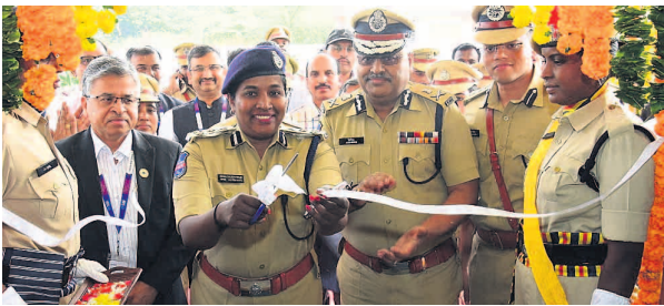
ప్రంగా అన్ని కమీషనరేట్, జిల్లాల్లో ఈ భరోసా కేంద్రాలను ఏర్పాటు చేస్తున్నామన్నారు. లైంగిక వేధింపుల కేసుల్లో శిక్షల శాతం పెరిగిందన్నారు.

కేంద్రం వద్ద ఏర్పాటు చేసిన శిలాఫలకాన్ని ఆవిష్కరించి, నూతన భరోసా కేంద్ర నూతన భవనాన్ని ప్రారంభించారు. భరోసా కేంద్రంలో బాధిత మహిళలకు సేవలందించేందుకు గాను ఏర్పాటు చేయబడిన గదులు, వాటిలో వసతులు పరిశీలించారు. ఈ సందర్భంగా డిజిపీ మాట్లాడుతూ 1000 గజాల స్థలంలో, 6800 చదరపు మీటర్ల విస్తీర్ణంలో చాల అద్భుతంగా నిర్మించారన్నారు. కరీంనగర్ లోని భరోసా కేంద్రంలో సేవలు సోమవారం నుండి అందుబాటు లోకి రానున్నాయన్నారు. లైంగిక వేధింపులకు గురైన బాధిత మహిళలకు, అసభ్యకరమైన లైంగిక ప్రవర్తనకు లోనైన పిల్లలకు పోలీస్ స్టేషన్లు, ఆసుపత్రులకు దూరంగా సురక్షితమైన వాతావరణంలో చేయూత అందించేందుకే తెలంగాణ రాష్ట్ర పోలీసుశాఖ, ఉమెన్ సేఫ్టీ వింగ్ ఆధ్వర్యంలో రాష్ట్రవ్యాప్తంగా