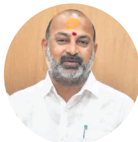
సూర్య కలీంగర్ ప్రతినిధి

వచ్చే సంక్రాంతి లోపు 'ఫీజు రీయంబర్స్ మెంబ్' మెత్తాన్ని చెల్లించాలని కేంద్ర హోం శాఖ సహాయ మంత్రి బండి సంజయ్ కుమార్ రాష్ట్ర ప్రభుత్వాన్ని డిమాండ్ చేశారు. లేనిపక్షం లో కిషన్ రెడ్డి ఆధ్వర్యంలో సంక్రాంతి తరువాత మహాసభలు చేసి రాష్ట్ర ప్రభుత్వ మేడలు వంచి తీరుతామని అల్లి మేటం జారీ చేశారు.