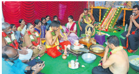
స్వాములు చేసే భజనలు, భక్తి గీతాలు వచ్చిన భక్తులను అలరించాయి.