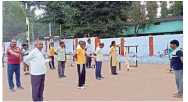
ఇబ్బంది పడుతున్న వాకర్స్