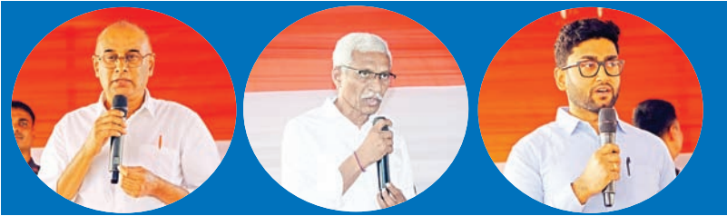
ఖమ్మం (సూర్య బ్యూరో):

-మునిసిపల్ కార్పొరేషన్ పరిధి 57వ డివిజన్ రమణగుట్టలో సీసీ రోడ్డు, స్టార్మ్ వాటర్ డ్రైన్ నిర్మాణ పనులకు శంకుస్థాపన చేసిన మంత్రి తుమ్మల