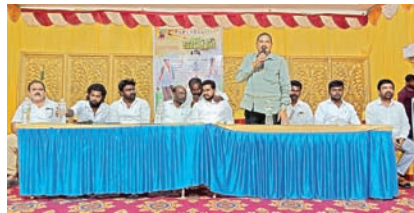
నూతనంగా ఎన్నికైన యూత్ కాంగ్రెస్ పార్టీ నాయకులకు ఘన సన్మానం