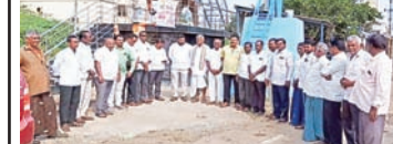
పెనుబల్లి సూర్య మేజర్ సూర్యన్....

- మండల కాంగ్రెస్, సిపిఎం పార్టీల ఆధ్వర్యంలో నిరసనలు