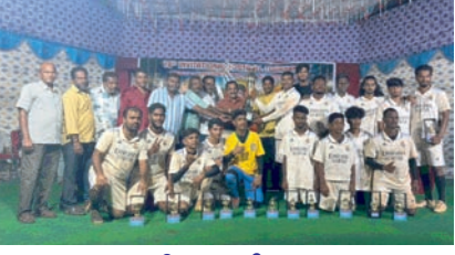
ద్వితీయ విజేత చర్ల

పాల్వంచ,సూర్య(మేజర్ న్యూస్)- గత రెండు రోజులుగా పాల్వంచలోని కేటీపీఎస్ విద్యుత్ కళాభారతి గ్రౌండ్ లో వాసు- హర్ష మెమోరియల్ ఆధ్వర్యంలో జరుగుతున్న ఆహ్వాన పుట్ బాల్ టోర్నమెంట్లో ప్రథమ బహుమతి ఇల్లండుకు చెందిన టీం విజయం సాధించింది. ద్వితీయ విజేతగా భద్రాద్రి కొత్తగూడెం జిల్లా చర్ల టీం విజయం సాధించింది. అనంతరం కళాభారతి వేదికపై జరిగిన బహుమతి ప్రధాన