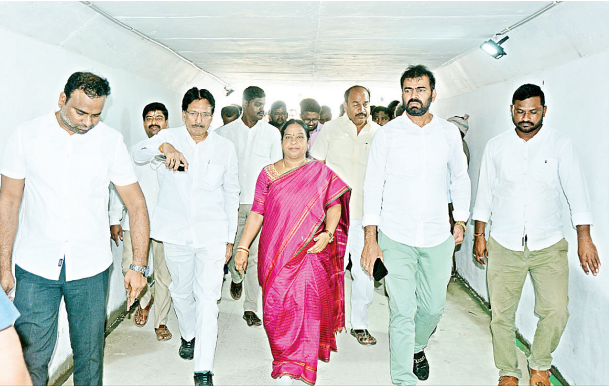
ఖమ్మం సూర్య టౌన్ న్యూస్