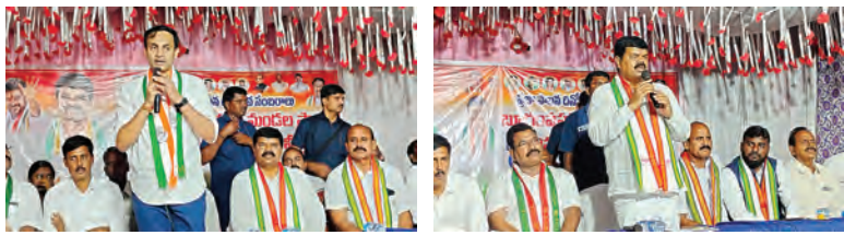
రూ 20 వేల కోట్ల రైతు రుణాలు మాఫీ చేసిన ఘనత కాంగ్రెస్ ప్రభుత్వానిదే