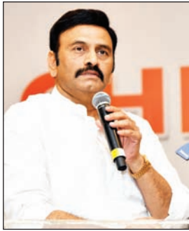
ముఖ్యమంత్రి అని కొనియాడారు.

అయినా పట్టుదలతో పోరాడుతున్నాం. మీరు నాకు ఇచ్చిన బాధ్యతను నెరవేర్చుతాను. క్రిస్టియన్ మిషనరీస్ ప్రోవీడెన్స్ డెవలప్మెంట్ బోర్డు ఏర్పాటు చేస్తాం. చర్చిల నిర్మాణానికి, పునరుద్ధరణకు ఆర్థిక సాయం అందిస్తాం. నేను ఎప్పుడూ పేదల పక్షపాతిగానే ఉంటాను. పేదరికం లేని సమాజం కోసం ఆలోచిస్తున్నాను. స్వర్ణాంధ్ర విజన్ 2047లో మొదటి అంశం పేదరిక నిర్మూలన గురించి పొందుపరిచాం. ఆర్థిక అసమానతలు తగ్గించేందుకు కలిసి పనిచేద్దాం' అని సీఎం చంద్రబాబు పిలపునిచ్చారు.