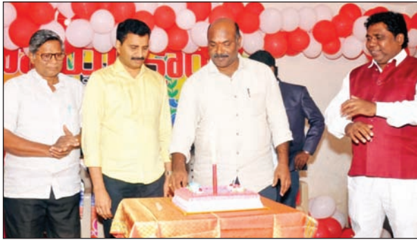
చల్లపల్లి - మేజర్ స్వాస్ : విజయ క్రాంతి జూనియర్, డిగ్రీ కాలేజ్ లో సెమీ క్రీస్మస్ వేడుకలు ఎంతో ఘనంగా నిర్వహించారు. ఈ కార్యక్రమానికి