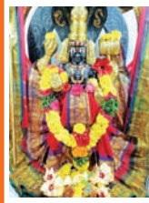
శ్రీ సుబ్రహ్మణ్యేశ్వర స్వామి వారి విగ్రహం