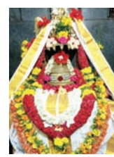
శ్రీ రామ లింగేశ్వర స్వామి వారి దివ్య లింగం

శ్రీ గంగా పర్వత వర్ధనీ సమేత శ్రీ రామ లింగేశ్వర స్వామి ఆలయం ఎస్.ఎస్.ఆర్. ఆంజనేయులు మిగతా 8లో