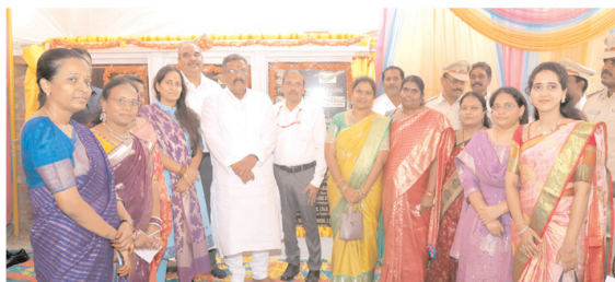
భూమిపూజ కార్యక్రమంలో పాల్గొన్న ఎంపి, ఎమ్మెల్యే, పోస్టల్ అధికారులు