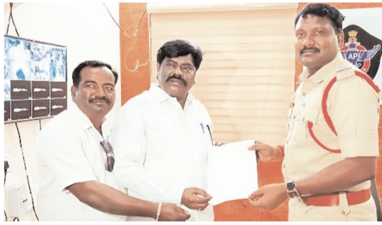
ఫిర్యాదు చేస్తున్న నాయకులు