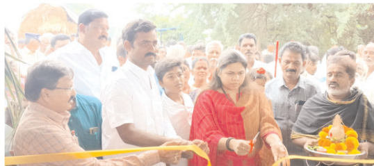
గోకులం పెద్దను ప్రారంభిస్తున్న ఎమ్మెల్యే

నుండి 4000వేల రూపాయలు ఇవ్వడం జరిగిందన్నారు. ఈ సందర్భంగా సి.ఎంక రాష్ట్ర ప్రజల తరపున ధన్యవాదాలు తెలుపుతున్నా