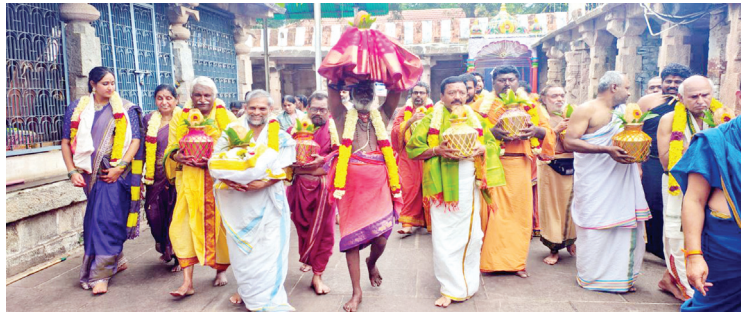
కలశ ప్రదక్షణ నిర్వహిస్తున్న దృశ్యం