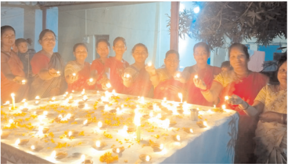
దీపాలను వెలిగిస్తున్న భక్త మహిళలు

హాళగుండ, మేజర్ న్యూస్ : హాళగుండలో కొలువైన ఆరాధ్యదైవం శ్రీ సవదత్తి యల్లమ్మ దేవి దేవాలయంలో కార్తీకమాసం సందర్భంగా దీపోత్సవ కార్యక్రమం భక్తులు ఘనంగా నిర్వహించారు. దేవికి, తుళసిమాతకు ప్రత్యేకంగా పూజలు చేశారు. దేవాలయంలో అలమరచిన దీపాలను ఓం నమః శివాయ అంటు నినాదాలు చేస్తూ భక్తిశ్రద్ధలతో భక్త మహిళలు దీపాలను వెలిగించారు. దేవికి దీపాలతో మహిళలు ఆరతి పట్టారు. ప్రతి ఏటా మాదిరిగానే ఈ సారి కూడా దీపోత్సవ కార్యక్రమాన్ని ఘనంగా నిర్వహించారు. వచ్చిన భక్తులకు ప్రసాదాలను అందించారు.