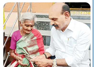
వృద్ధులారికి పెన్షన్లు అందజేస్తున్న మంత్రి ఎన్.ఎం.డి ఫరూక్

● ఇది ప్రజల సంక్షేమ ప్రభుత్వం ● ఇచ్చిన హామీలు చంద్రబాబు తూచా అమలు నంద్యాల కల్పరత్, మేజర్ న్యూస్ : అవ్వా... చంద్రబాబు పెన్షన్ ఒకరోజు ముందుగానే ఇచ్చాడని మిగతా 6లో