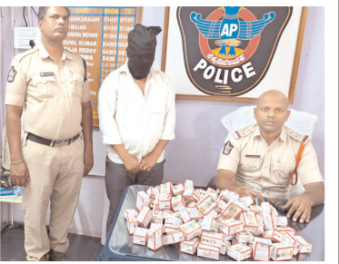
కర్ణాటక మద్యంతో పోలీసులు