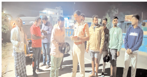
ద్వీపక్ర వాహనదారుడి వివరాలను సేకరిస్తున్న పోలీస్ అధికారి