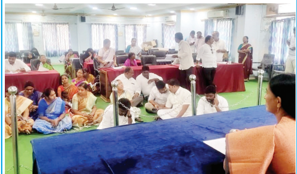
కౌన్సిల్ సమావేశంలో సభ్యుల మధ్య వాగ్వివాదం చేస్తున్న మున్సిపల్ చైర్మన్