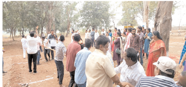
టగ్ ఆఫ్ వార్ ఆడుతున్న అధికారులు