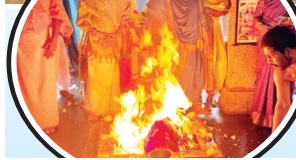
మహాపూర్ణాహతి నిర్వహిస్తున్న దృశ్యం