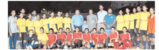
క్రీడాకారులతో మాట్లాడుతున్న వీసీ