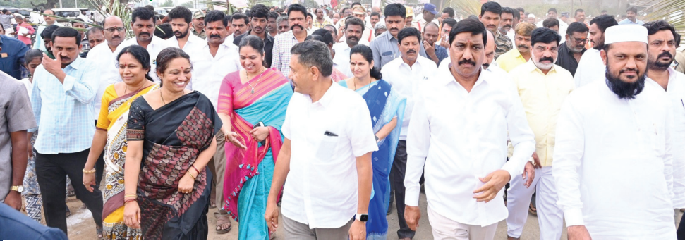
కార్తీక వసంతు జనానికి తరలివెళ్లుతున్న మంత్రులు, ఎమ్మెల్యేలు, టీడీపీ నాయకులు, కార్యకర్తలు