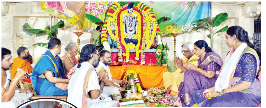
మహానంది పుణ్యక్షేత్రంలో కలశ పూజ నిర్వహిస్తున్న దృశ్యం