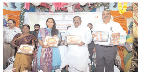
పోస్టల్ స్టాంపులను ఆవిష్కరిస్తున్న ఎంపి, ఎమ్మెల్యే, పోస్టల్ అధికారులు