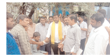
సింఘన్న అందజేస్తున్న ఎమ్మెల్యే బొగ్గల దర్శగిరి

కర్నూలు ఎడ్యుకేషన్, మేజర్ న్యూస్: ఎన్టీఆర్ భరోసా పెన్షన్లను ఒకరోజు ముందుగానే పంపిణీ చేశారు. కర్నూలు రూరల్ మండల పరిధిలోని