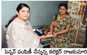
పెన్షన్ పంపిణీ చేస్తున్న కలెక్టర్ రాజకుమారి