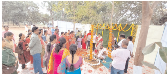
ఉసిరిచెట్టుకు పూజలు నిర్వహిస్తున్న దృశ్యం