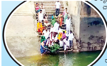
తెలుగుగంగలో బిల్వాలకు నిమజ్జనం చేస్తున్న దృశ్యం