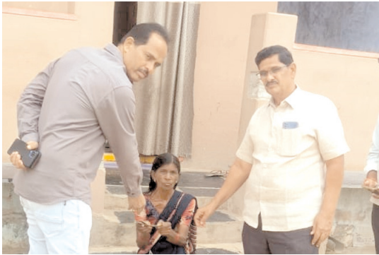
పింఛన్లు అందజేస్తున్న దృశ్యం

కల్లూరు, మేజర్ న్యూస్: కల్లూరు మండల పరిధిలోని ఉలిందకొండ గ్రామంలో శనివారం ఎంపీడివో జిఎన్ఎస్.రెడ్డి పర్యటించారు. మొదటగా గ్రామంలో నిర్వహిస్తున్న సామాజిక పింఛన్ల పంపిణీ కార్యక్రమంలో పాల్గొని లబ్ధిదారులకు పింఛన్లు అందజేశారు. అనంతరం ఎస్సీ వెల్ఫేర్ బాలికల హాస్టల్ ను పరిశీలించారు. విద్యార్థినిలకు అందుతున్న సౌకర్యాలను అడిగి తెలుసుకున్నారు. అనంతరం పల్లెపండుగలో మంజూరైన రోడ్డునిర్మాణాన్ని తనిఖీ చేశారు. పనులను నాణ్యతగా చేపట్టాలన్నారు. గ్రామంలోని ప్రాథమిక పాఠశాలను తనిఖీ చేసి మధ్యాహ్న భోజనాన్ని పరిశీలించారు. ఎంపీడివో వెంట ఈవోఆర్డి నగేష్, ఆయా శాఖల అధికారులు ఉన్నారు.