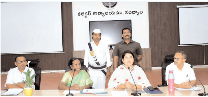
ప్రిన్సిపాళ్ళ సమావేశంలో మాట్లాడుతున్న కలెక్టర్