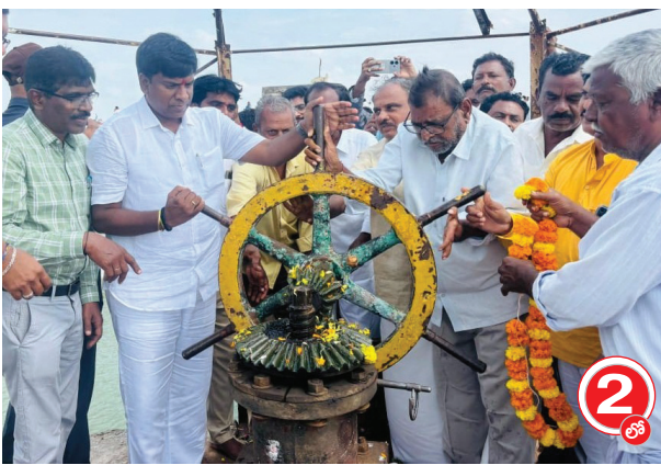
జడిపీ నీటిని విడుదల చేస్తున్న ఎమ్మెల్యే బీబీ