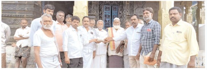
విరాళాన్ని గ్రామ పెద్దలకు అందజేస్తున్న దృశ్యం