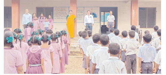
విద్యార్థులతో కలిసి ప్రార్థన సమయంలో డిఈఓ