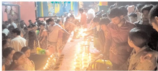
దీపం వెలిగిస్తున్న భక్తులు

కోసిగి, మేజర్ న్యూస్: మండల కేంద్రమైన కోసిగిలో ఘనంగా, కన్నుల పండుగగా కార్తీక పూజలు నిర్వహించడం జరిగింది. ఈ సందర్భంగా కోసిగిలో వెలసిన కోసిగియ్య (అంజనేయస్వామి) సోమవారం అర్చరాత్రి నుండి స్వామివారికి ప్రత్యేక పూజలు నిర్వహించారు. కుంకుమార్చన, మంగళారతి, ఆకుపూజ వంటి