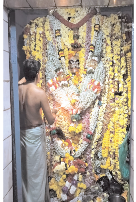
పూజలందుకుంటున్న కోసిగియ్య స్వామి

పూజలు సర్వహించారు. అలాగే కార్తీకమాసం మొదలైనప్పటి నుండి ఇప్పటివరకు ఎలాంటి దురలవాట్లకు, చెడలవాట్లకు పోకుండా నియమ-నిబంధనలతో నిష్ఠగా ఉండి కార్తీక పూజ రోజున మొక్కులు తీర్చుకుంటారు. భక్తులు దేవాలయంలో కార్తీక దీపాన్ని వెలగించి మొక్కులు తీర్చుకుంటారు. అలాగే సాయంత్రం యువతీ యువకులు కోటాలాటతో ఆకట్టుకున్నారు.