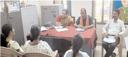
సమావేశంలో మాట్లాడుతున్న ఎంపిడిఓ, హౌసింగ్ బోర్డు డిఈ, ఎఈలు

★ నిర్లక్ష్యం వహిస్తే సహించేదిలేదని సచివాలయ ఇంజనీరింగ్ అసిస్టెంట్లపై మండిపడిన ఎంపిడిఓ, హౌసింగ్ బోర్డు డిఈ