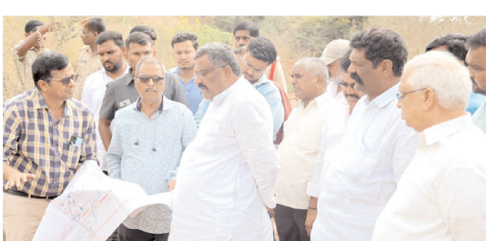
చెరువుల ఫైవ్లైన్ పనుల గురించి ఎమ్మెల్యే కోట్లకు వివరిస్తున్న అధికారులు

ప్యాపిలి, మేజర్ న్యూస్: దేశ పురోగాభివృద్ధి సాధించాలంటే పచ్చని పొలాలతో పల్లెలు బాగున్నప్పుడే అది సాధ్యమౌతుందని రైతులు బాగుంటేనే దేశం కూడా బాగుంటుందని డోన్ ఎమ్మెల్యే కోట్ల జయసూర్యప్రకాశ్ రెడ్డి అన్నారు. మండల పరిధిలోని హుస్సేనాపురం గ్రామంలోని గ్రౌరెలపెంపకందారుల శిక్షణ కేంద్రాన్ని మంగళవారం ఎమ్మెల్యే కోట్ల పరిశీలించారు. ఎమ్మెల్యే కోట్లకు సిబ్బంది ఘన స్వాగతం పలికారు. అనంతరం ఆయన రైతులతో శిక్షణ కేంద్రంలో ఏర్పాటు చేసిన సమావేశంలో ఎమ్మెల్యే కోట్ల మాట్లాడుతూ ఓ రైతు బిడ్డగా రైతుల శ్రేయస్సు కోసం తనవంతు కృషి చేస్తానన్నారు. ప్రభుత్వం సబ్సిడీ కింద పశువులను తీసుకున్న పశువుల యజమానులు వాటిని అమ్ముకోవడం సరైనదికాదని, ప్రస్తుతం ప్రతి గ్రామంలో పశుజాతి కనుమరుగైపోతున్నందుకు ఎంతో బాధాకరంగా ఉందన్నారు. పూర్వపు కాలంనాటి రోజులు మరల రావాలని, ఎద్దులు, ఆవులు, బర్రెలను పోషించి పశుసంపదను పెంచాలని రైతులకు సూచించారు. అనంతరం గ్రామంలోని జిడ్చిహెచ్ స్కూల్ను