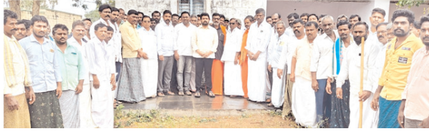
సమావేశంలో మాట్లాడుతున్న తెలుగుదేశం నాయకులు

ఫింబనీ 6వేల రూపాయలు అందిస్తున్న ఘనత కూటమి ప్రభుత్వానికే దక్కతుంద