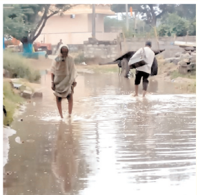
వర్షం నీరు నిల్వ ఉన్న దృశ్యం

అన్నరి, మేజర్ న్యూస్ : మండల పరిధిలోని అట్టేకల్లు గ్రామంలో వర్షం వస్తే చిత్తడి చిత్తడిగా మారుతుందని గ్రామప్రజలు ఆరోపించారు. మంగళవారం వర్షం నీరు నిల్వ 100 మీటర్ల వరకు నిల్వ ఉంటుందని, నీటిని బయటకు తరలించే నాథుడే కరువ య్యారని గ్రామస్థులు వాపోయారు. గ్రామంలో సీసీరోడ్డు వేస్తామనే ధీమాతో మాట్లాడుతున్నారన్నారు. గ్రామంలో ప్రతినిత్యం ప్రజలు గొడవలకు దిగుతున్నారన్నారు. వర్షం నీటిని బయటకు పంపి డ్రైనేజీ ఏర్పాటు చేయాలని, వర్షం వస్తే చిన్న పిల్లల నుండి పెద్దల వరకు అనారోగ్యం బారిన పడుతున్నారన్నారు. నేతలు మారినా మా బ్రతుకులు మారవని, తల రాతలు మారవని తెలియజేశారు. గ్రామానికి ఎకాఈ వస్తే సమస్యలను విన్నవించకుండా వెనుతిరిగి వెళ్లారని ఆరోపించారు. ఇప్పటికైనా అధికారులు స్పందించి డ్రైనేజీ, వర్షం నీరు రాకుండా తగు చర్యలు తీసుకొని సమస్యలను పరిష్కరించాలని ఎకాఈ వెంకటేశులు గ్రామస్థులు కోరుతున్నారు.