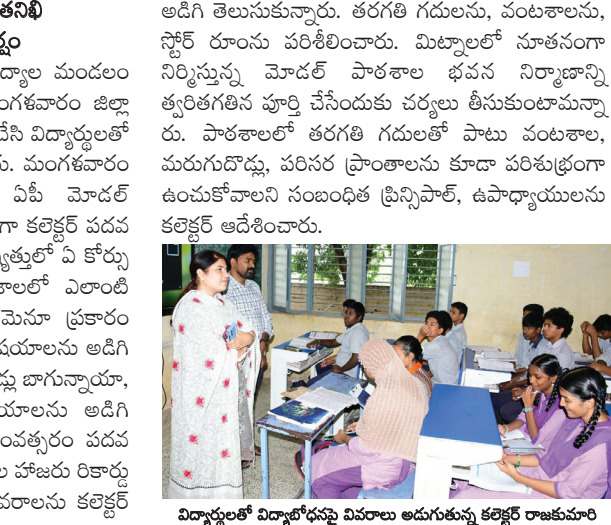
విద్యార్థులతో విద్యాబోధనపై వివరాలు అడుగుతున్న కలెక్టర్ రాజకుమారి

అడిగి తెలుసుకున్నారు. తరగతి గదులను, వంటశాలను, స్టోర్ రూంను పరిశీలించారు. మిట్టాలలో నూతనంగా నిర్మిస్తున్న మోడల్ పాఠశాల భవన నిర్మాణాన్ని త్వరితగతిన పూర్తి చేసేందుకు చర్యలు తీసుకుంటామన్నారు. పాఠశాలలో తరగతి గదులతో పాటు వంటశాల, మరుగుదొడ్డు, పరిసర ప్రాంతాలను కూడా పరిశుభ్రంగా ఉంచుకోవాలని సంబంధిత ప్రిన్సిపాల్, ఉపాధ్యాయులను కలెక్టర్ ఆదేశించారు.