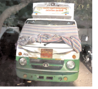
ఎండియు వాహనాన్ని మూలన పెట్టిన దృశ్యం

స్థానిక నాయకులకు, అధికారులు కు ఎండియు ఆపరేటర్లు మామూళ్లు ఇస్తున్నారని అందుకే ఐదు నెలలుగా పనిచేయ కున్నా వేతనాలు ఇస్తున్నారని వెంటబడి పని చేయించాల్సిన రెవెన్యూ అధికారులు మామూళ్ల మత్తులో ఉన్నారు.ఈ విషయమై స్థానిక తాలూకా నాయకుడు రంగం లోకి దిగి ఎండియు ఆపరేటర్ల కు వత్తాను పలికినట్లు సమాచారం.ఎండియు ఆపరేటర్లపై చర్యలు తీసుకోకుండా రెవెన్యూ అధికారులపై ఆగ్రహం చెందినట్లు తెలిసింది.ఇందులో ఉప్పు అందించిన వ్యక్తి కూడా లక్ష రూపాయలు నెలకు ఇవ్వడానికి ఎండియు ఆపరేటర్లు ఇవ్వడానికి అంగీకారం చెందినట్లు తెలిసింది.ఏదీ ఏమైనా ప్రభుత్వం కొంతమంది ఉద్యోగులకు జీతాలు పెంచాలని నోరు,నెత్తి మొత్తుకున్నా ఒక్క రూపాయి కూడా ఇవ్వదు కానీ పనిచేయని వారికి మాత్రం లక్షల్లో వేతనాలు అందిస్తుందని ప్రజలు వాపోతున్నారు. ఇప్పటికయినా జిల్లా అధికారులు, మంత్రి నాదెండ్ల మనోహర్ ఎండియు ఆపరేటర్లపై చర్యలు తీసుకోవాలని కోరుతున్నారు.