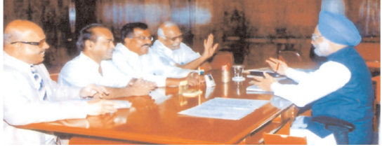
మన్మోహన్ సింగ్ తో టీజీ వెంకటేష్ (మైక్రోఫోన్)

- మాజీ రాజ్యసభ సభ్యులు టీజీ వెంకటేష్ కర్నూలు, మేజర్ న్యూస్ ప్రతినిధి: దేశంలో ఆర్థిక సంస్కరణలు తీసుకువచ్చి దేశాన్ని ఆర్థిక సంక్షోభం నుంచి గట్టికించిన మన్మోహన్ సింగ్ దివంగత మాజీ ప్రధాని మన్మోహన్ సింగ్ అని రాజ్యసభ మాజీ సభ్యులు టీజీ వెంకటేష్ అన్నారు. మన్మోహన్ సింగ్ మృతి పట్ల తీవ్ర సంతాపాన్ని వ్యక్తం చేస్తూ మన్మోహన్ సింగ్ మృతి దేశానికి తీరని లోటు అన్నారు. రిజర్వ్ బ్యాంక్ గవర్నర్ గా, ఆర్థిక మంత్రి, ఆ తర్వాత ప్రధానమంత్రిగా ఆయన దేశానికి అందించిన సేవలు మరువలేనివన్నారు. దేశం తీవ్ర ఆర్థిక సంక్షోభంలో ఉన్నప్పుడు సంస్కరణలు చేపట్టి, సంక్షోభం నుంచి గట్టికించడమే కాకుండా ప్రజలకు ఎన్నో రకాల సంక్షేమ పథకాలు అందజేసిన ఘనత మన్మోహన్ సింగ్ కే దక్కుతుందని టీజీ వెంకటేష్ కొనియాడారు. తెలంగాణ ఉద్యమంలో రాష్ట్రం విడిపోతే రాయలసీమకు జరిగే అన్యాయాన్ని అప్పటి ప్రధాని మన్మోహన్ సింగ్ కు వివరిస్తే దానికి ఆయన స్పందిస్తూ వెనుకబాటుకు