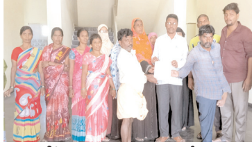
ఎంపీడిఓ కు వినతిపత్రం అందిస్తున్న కాలనీ వాసులు