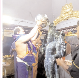
తైలాభిషేకం నిర్వహిస్తున్న దృశ్యం