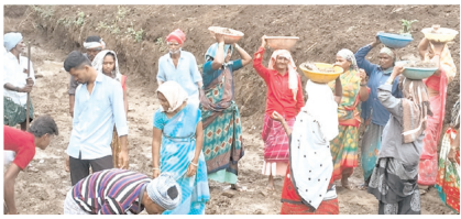
పనులు చేస్తున్న కూలీలు

తుగ్గలి, మేజర్ న్యూస్: మండల పరిధిలోని అమీనాబాద్ గ్రామంలో ఉపాధి హామీ పనులు జోరుగా సాగుతున్నాయి. దీంతో గ్రామంలోని పలువురు వ్యవసాయ కూలీలు ఉపాధి హామీ పనులకు వెళ్లి జీవనోపాధి పొందుతున్నారు. ఫీల్డ్ అసిస్టెంట్ సర్టిఫికేటర్ కూలీలకు పనులు