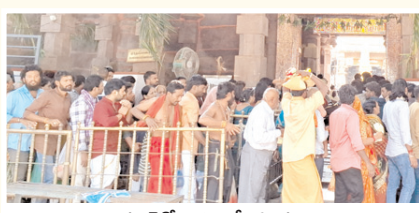
క్యూలైన్లో బారులు తీరిన భక్తులు

శ్రీశైల,మేజర్ న్యూస్: జ్యోతిర్లింగా క్షేత్రమైన శ్రీశైల క్షేత్రం భక్తజన సందోహంగా మారింది.వివిధ ప్రాంతాలకు చెందిన భక్తులతో ఉపాధ్యాయులు శనివారం కళకళ లాడయ్యాయి. రెండు తెలుగు రాష్ట్రాలతో పాటు కర్ణాటక, తమిళనాడు,మహారాష్ట్ర తదితర రాష్ట్రాలకు చెందిన భక్తులు అధిక సంఖ్యలో శ్రీశైలానికి తరలించారు. వేకువజామునే పాతాళగంగలో పుణ్య స్నానాలు ఆచరించి స్వామి అమ్మవార్ల దర్శనార్థమే ఆలయ క్యూలైన్లలో భక్తులు బారులు తీరారు.దీంతో ఉచిత,శీఘ్ర,అతి శీఘ్ర క్యూలైన్లు భక్తులతో కిక్కిరి సాయి.భక్తులకు ఎలాంటి అసౌకర్యం కలగకుండా దేవస్థానం విస్తృత ఏర్పాట్లు చేపట్టింది.గంటల తరబడి ఆలయ క్యూలైన్లో నిరీక్షించి భక్తులు స్వామి అమ్మవార్లని దర్శించుకున్నారు.ఆదివారం భక్తుల రద్దీ మరింతగా పెరగనుంది.