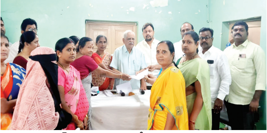
చైర్మన్ కు వివరించే అందజేస్తున్న వైకాపా కౌన్సిలర్లు

అక్షగడ్డ మున్సిపల్ కౌన్సిల్ సమావేశంలో స్పష్టం చేసిన వైకాపా కౌన్సిలర్లు -పదవ అజెండాను మినహాయించి మిగతా వాటికి ఆమోదం