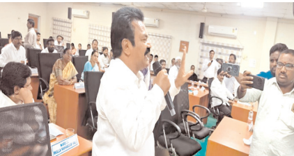
మాట్లాడుతున్న వైసీపీ మున్సిపల్ వైస్ చైర్మన్ పాంపావలి

ఇప్పటికైనా పద్ధతి మార్చుకోవాలని హితవు పలికారు. ప్రోటోకాల్ నిబంధనలు కొన్ని సభ్యులకు ఉండాలేదా అని కొన్ని సభ్యులు అడగడంతో కమిషనర్, కొన్ని సభ్యుల మధ్య కాసేపు ప్రోటోకాల్ వివాదం సాగింది. మార్షల్ ప్లాన్ అమలయ్యే ప్రాంతాల్లో ప్రజలకు అవగాహన కల్పించాలని ఇళ్ళ కట్టుకొనే వారికి