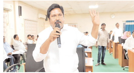
కొన్నిలో సమస్యను చెబుతున్న టీడీపీ కొన్నిలర్ మాబువలి

పట్టించుకోకుండా కొన్ని ఆమోదించడం చూస్తుంటే టీడీపీ పట్టుకోల్పోయిందని చెప్పవచ్చు. మాజీ మున్సిపల్ చైర్పర్సన్ దేశం నులోచన పారిశుధ్య సిబ్బంది వద్ద కొందరు అధికారులు డబ్బులు అడగడం సిగ్గుచేటని కొన్ని దృష్టికి తీసుకుని వచ్చారు. మరోసారి ఇలాగే జరిగితే పేర్లు బహిష్కారం చేయాల్సి ఉంటుందని