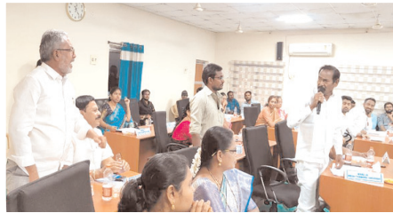
కొన్నిలో టీడీపీ, వైసీపీ కొన్నిలర్ల వాదనలు