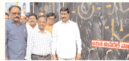
మినరల్ వాటర్ ప్లాంట్ ప్రారంభిస్తున్న దృశ్యం

కాలంగా మినరల్ వాటర్ ప్లాంట్ అందుబాటులో లేక ఇబ్బందులకు గురవుతున్నారని వారికి శుద్ధజలాన్ని అందించాలన్న ఉద్దేశంతో మంత్రి బి.సి శనివారంనాడు మినరల్ వాటర్ ప్లాంట్ ను ప్రారంభించడం జరిగింది.