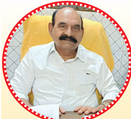
మీడియా సమావేశంలో మాట్లాడుతున్న రాష్ట్ర న్యాయశాఖ మంత్రి ఎన్.ఎం.డి.ఫరూక్

నంద్యాల కల్చరల్, మేజర్ న్యూస్ : వైసీపీ ధర్మాలకు ప్రజల్లోనే కాదు.. సొంత పార్టీలోనూ స్పందన లేదని.. ఛార్జీలను పెంచి ఇప్పుడు ధర్మాలు అంటూ ప్రజలకు కల్లబొల్లి మాటల చెబితే ఎవరూ నమ్మరని.. ఉనికి కోసం ఆందోళనలు చేపట్టడం ఎంతవరకు సబబు అని జగన్ విధ్వంసం చేసిన విద్యుత్ శాఖను ఏపీసీఎంఎం ప్రజాబునాయుడు గాడినపెడుతున్నారని రాష్ట్ర న్యాయశాఖ మంత్రి ఎన్.ఎం.డి. ఫరూక్ అన్నారు. శనివారం రాజ్ థియేటర్ లోని తెలుగుదేశం పార్టీ కార్యాలయంలో మంత్రి ఫరూక్ మాట్లాడుతూ కూటమి ప్రభుత్వం అధికారంలోకి వచ్చిన తరువాత ఇంతవరకు విద్యుత్ ఛార్జీలను పెంచలేదని జగన్మోహన్ రెడ్డి అధికారంలో ఉన్నప్పుడు చేసిన పాపాల కారణంగా విద్యుత్ ఛార్జీలు పెరిగాయన్నారు. 22.5 మిలియన్ యూనిట్ల కొరత ఉన్న రాష్ట్రాన్ని 2019 నాటికి మిగులు విద్యుత్ రాష్ట్రంగా తీర్చిదిద్దే వైసీపీ ప్రభుత్వానికి నాటి టీడీపీ ప్రభుత్వం అప్పగించిందన్నారు. 2014 నుంచి 2019వరకు కూడా తెలుగుదేశం ప్రభుత్వం ఒక్క రూపాయి కరెంటు ఛార్జీలు పెంచలేదని గుర్తు చేశారు. 2019 నుంచి 2024వరకు అధికారంలో ఉన్న ప్రజలపై రూ. 35వేల కోట్ల విద్యుత్ భారాన్ని మోపడమే కాకుండా మిగతా 2లో