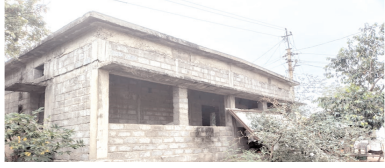
చిన్నపూట గ్రామంలో నిర్మాణ దశలోనే ఆగిపోయిన అంగన్ వాడీ భవనం ఇదే

హొళగుండ, మేజర్ న్యూస్: హొళగుండ మండల పరిధిలోని చిన్నపూట గ్రామంలో అంగన్ వాడీ నూతన భవన నిర్మాణం అర్ధాంతరంగా ఆగిపోయింది. దీంతో గ్రామంలో పక్క భవనం లేక పూర్తి గుడిసెలో అంగన్ వాడీ కేంద్రాన్ని నిర్వహించే పరిస్థితి నెలకొంది. గుడిసె వర్షా కాలంలో కారుతుండడంతో సరుకులు నానిపోతున్నాయి. బాలింతలకు, పిల్లల బోధనకు చాలా ఇబ్బందికరంగా మారింది. నూతన భవన నిర్మాణ దశలో ఆగిపోయిన దాన్ని పూర్తి చేయలేకపోతున్నారని గ్రామ ప్రజలు చెప్పారు. బాలియలు, పిల్లల దృష్టిలో ఉంచుకుని వెంటనే సంబంధిత అధికారులు స్పందించి ఆగిపోయిన భవనాన్ని వెంటనే పూర్తి చేయాలని గ్రామస్థులు కోరుతున్నారు.