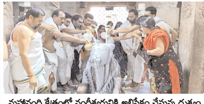
మహానంది క్షేత్రంలో నందిశ్వరునికి అభిషేకం చేస్తున్న దృశ్యం