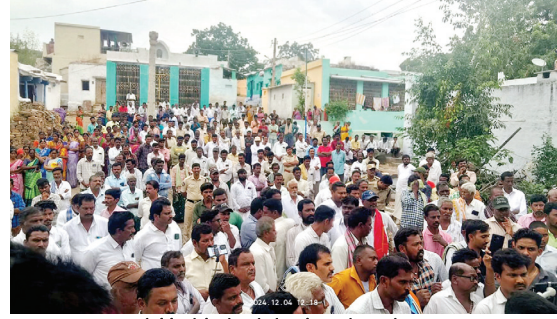
సభకు తరలివచ్చిన మూడు గ్రామాల ప్రజలు