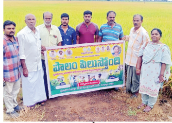
పొలం పిలుస్తోంది కార్యక్రమంలో వ్యవసాయ సిబ్బంది రైతులు

దొర్నిపాడుమేజర్,న్యూస్: రైతులు డిసెంబరు 15లోగా పంటల భీమా చేసుకోవాలని మండల వ్యవసాయ అధికారి ఏ. ప్రమీళ రైతులకు సూచించారు. బుధవారం మండల పరిధిలోని అమ్మినగరం, అర్జునాపురం గ్రామాలలో పొలం పిలుస్తోంది కార్యక్రమాన్ని నిర్వహించారు. ఈ సందర్భంగా ఆమె మాట్లాడుతూ రబీలో పంటలు సాగు చేసిన రైతులు రైతు భరోసా కేంద్రంలో పంట నమోదు చేయించుకోవాలని ఆమె తెలిపారు. అలాగే రైతులకు పరి పంట సాగులో యాజమాన్య పద్ధతులపై క్షేత్రస్థాయిలో వివరించడం జరిగింది. వ్యవసాయ అధికారుల సూచనలు, సలహాల