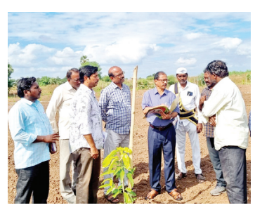
తోటలపై అవగాహన కల్పించాలన్నారు. జాబ్ కార్డ్ లేనివారికి జాబ్ కార్డు ఇప్పించాలని జాబ్ కార్డు ఉన్నప్రతి ఒక్కరు