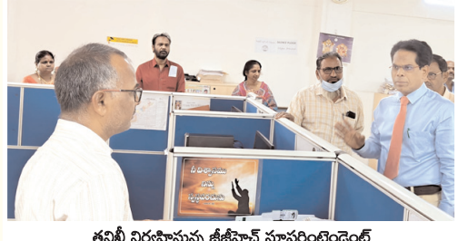
తనీషీ నిర్వహిస్తున్న జీజీహెచ్ సూపరింటెండెంట్