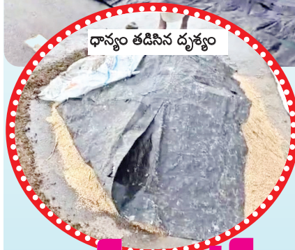
ధాన్యం తడిసిన దృశ్యం

ఆళ్లగడ్డ, మేజర్ న్యూస్: ఆళ్లగడ్డ నియోజకవర్గంలో ఫెంగల్ తుఫాన్ ప్రభావంతో గత రెండు మూడు రోజులుగా భారీ వర్షాలు కురుస్తుండడంతో పంటలు అతలాకుతల మయ్యాయి. ముఖ్యంగా రుద్రవరం మండలంలో తుఫాను తాకిడి అధికంగా ఉంది. సంక్రాంతి పండగకు ముందు చేతికి అందవలసిన పరి పంట తుఫాన్ తాకిడికి పూర్తిగా నేలకు ఒరిగిపోయింది. వేలాది ఎకరాలలో పంట నష్టం వాటిల్లింది. రుద్రవరం మండలంలోని ముత్తలూరు, నరసాపురం, హరి నగరం, చిత్రనిపల్లె, మిగతా 2లో |