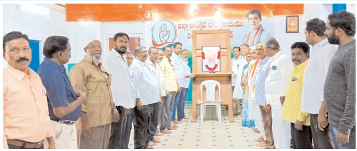
నివాళులర్పిస్తున్న కాంగ్రెస్ నాయకులు