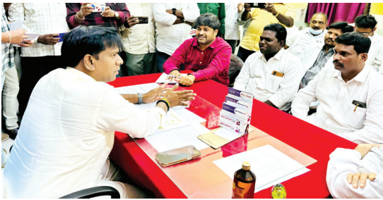
హెచ్ డిసి సమావేశంలో మాట్లాడుతున్న ఎమ్మెల్యే బీవీ

ట్రామా కేర్ సెంటర్ ఏర్పాటుకు ప్రతిపాదన ప్రభుత్వానుపత్తిని పరిశీలించిన ఎమ్మెల్యే బీవీ