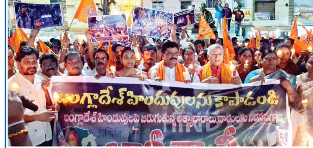
క్యాండిల్స్ చేతబట్టి బంగ్లాదేశ్ లో హిందువులపై దాడులను ఖండిస్తూ భారీ ర్యాలీ చేపట్టిన దృశ్యం

హిందూ పరిరక్షణ వేదిక ఆధ్వర్యంలో నిరసన ర్యాలీ నంద్యాల కల్చరల్, మేజర్ న్యూస్ : బంగ్లాదేశ్ లో హిందువులపై దాడులను ఖండిస్తూ హిందూ పరిరక్షణ వేదిక ఆధ్వర్యంలో పట్టణంలోని భరత మాత ఆలయం వద్ద నుంచి ఆరేవెన్ ఏస్, ఇతర హిందూ సంస్థలు, ప్రజలు, మహిళలు క్యాండిల్స్ చేత పట్టుకుని భారీ ర్యాలీ చేశారు. ఈ ర్యాలీ భరతమాత గుడి వద్ద నుంచి శ్రీనివాససింహర్ మీదుగా కల్వనా సింహర్, గాంధీచౌక్ వద్దకు చేరుకుంది. ఈ సందర్భంగా మిగతా 2లో |