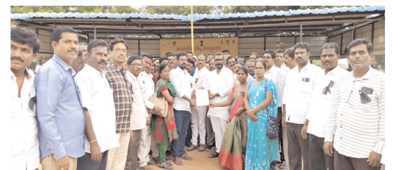
ఎమ్మెల్యేకు వినతిపత్రం అందజేస్తున్న వెలుగు సిబ్బంది