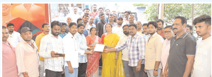
వినతిపత్రం అందజేస్తున్న దృశ్యం

కల్లూరు, మేజర్ న్యూస్: కర్నూలు మున్సిపల్ కార్యాలయంలో పనిచేస్తున్న కార్మికుల వేతనాల పెంపుకు చర్యలు తీసుకోవాలని ఆంధ్రప్రదేశ్ మున్సిపల్ ఇంజనీరింగ్ వర్కర్స్ యూనియన్ నాయకులు కోరారు. ఈ మేరకు బుధవారం పాణ్యం ఎమ్మెల్యే గౌరవచరితారెడ్డి స్వగృహంలో ఆమెను కలిసి అందజేశారు. వేతనాల పెంపు చేయకపోతే ఈ నెల 9వతేదీ నుంచి నమ్మెలోకి వెళ్ళామని తెలిపారు. ఈ కార్యక్రమంలో ఆంధ్రప్రదేశ్ మున్సిపల్ ఇంజనీరింగ్ వర్కర్స్ యూనియన్ నాయకులు పాల్గొన్నారు.