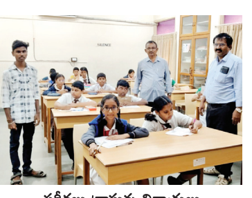
పరీక్షలు వ్రాస్తున్న విద్యార్థులు