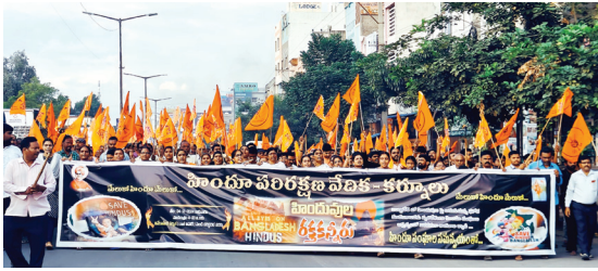
ర్యాలీ నిర్వహిస్తున్న దృశ్యం