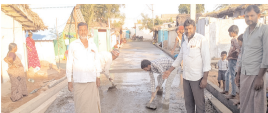
కాలనీలో సీసి రోడ్డు వేస్తున్న దృశ్యం

రూపాయలతో సీసి రోడ్డు, డ్రైనేజీ పనులను చేపట్టారు. గ్రామంలో కాలనీ ఏర్పాటు అయిస్తున్నట్లు నుండి ఇప్పటి వరకు కాలనీలో డ్రైనేజీ కూడా ఏర్పాటు చేయలేదని టీడీపీ ప్రభుత్వం అధికారంలోకి వచ్చిన వెంటనే గ్రామాల్లో డ్రైనేజీ, సీసి రోడ్డు పనులను చేపట్టారని రాజీయే కాలంలో మరిన్ని నిధులతో గ్రామంలో అభివృద్ధి చేపడుతున్నట్లు