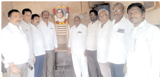
ఘంటసాల చిత్రపటానికి నివాళులర్పిస్తున్న నాయకులు