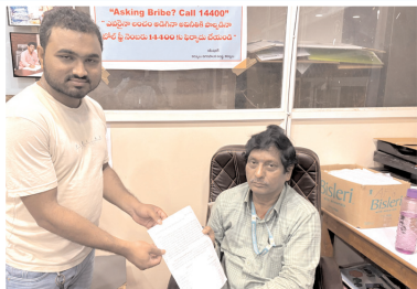
వినతిపత్రం అందజేస్తున్న దృశ్యం