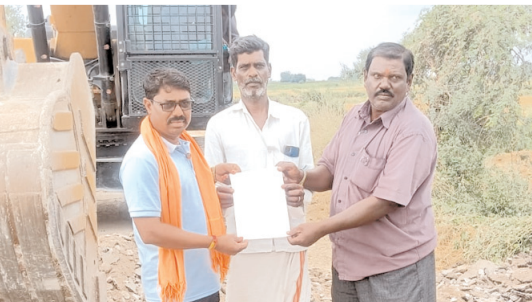
రోడ్డు మరమ్మత్తుకు నిధులు మంజూరైనట్లు వత్రం చూపిస్తున్న దృశ్యం