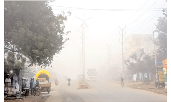
రహదారులను కమ్మేసిన పొగమంచు

ఎమ్మిగనూరు టౌన్, మేజర్ న్యూస్: ఎమ్మిగనూరు పట్టణంలో బుధవారం దట్టమైన పొగమంచు కమ్మేసింది. ఉదయం ఆరుగంటల నుంచి ఎనిమిది గంటల వరకు 10 అడుగుల దూరంలో ఉన్నవి కనిపించినంతగా మంచు కమ్మేసింది. వాహనదారులు తీవ్ర ఇబ్బంది పడ్డారు. హెడ్ లైట్లు వెలుతురులో ప్రయాణం సాగించారు. పట్టణ శివారులోని కర్నూలు బైపాస్ రోడ్డు, ఆదోని రోడ్డు, గుడికల్లు రోడ్డు, మంత్రాలయం ప్రధాన రహదారులను పొగ మంచు కమ్మేసింది. చలి త్రివతకు రహదారులను పొగమంచు కమ్మేయడంతో ప్రజలు ఇబ్బందులు పడుతున్నారు.