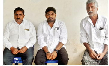
మాట్లాడుతున్న టిడిపి నాయకులు

ఆళ్లగడ్డ, మేజర్ న్యూస్ : శిరివెళ్ల మండల పరిధిలోని వీరారెడ్డి పల్లె గ్రామపంచాయతీ లో బుధవారం జరిగిన పాల సొసైటీ ఎన్నికల్లో తెలుగుదేశం పార్టీ విజయ ధంకా మ్రోగించింది. విజయ పాల డైరీ జిల్లా ప్రతినిధులు, ఇతర ప్రముఖుల ఆధ్వర్యంలో పటిష్ట బంధోపస్థు మధ్య జరిగిన పాల సొసైటీ ఎన్నికల్లో తెలుగుదేశం పార్టీ సునాయాసంగా విజయం సాధించి తమ అభ్యర్థులను విజయపతాన నిలుపుకున్నది. వీరారెడ్డిపల్లె గ్రామపంచాయతీలో ఉన్నటువంటి పాల డైరీ సొసైటీ సుదీర్ఘకాలం పాడి పరిశ్రమ అభివృద్ధికి ఎంతగానో కృషి చేసింది. ఈ సందర్భంగా తెలుగుదేశం పార్టీ