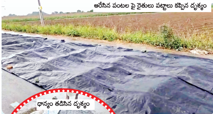
ఆరేసిన పంటల పై రైతులు పట్టలు కప్పిన దృశ్యం