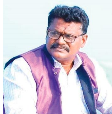
మాలల సింహ గర్జనతో కేంద్ర రాష్ట్ర ప్రభుత్వాల కళ్ళు తెరిపిద్దామన్నారు.

జరిగే మాలల ఆత్మగౌరవ సభను విజయవంతం చేయాల్సిన అవసరం ప్రతి ఒక్క మాల బిడ్డపై ఉ ఉంది అంటూ దుష్ప్రచారం చేస్తున్న అవినేకల కళ్ళు తెరిపి%శీ%చవలసిన అవసరం ఎంతైనా ఉ ఉందని అన్నారు. హైదరాబాదు నగరాన్ని నీలిమయం చేసే విధంగా ప్రతి మాల జాతి బిడ్డ తమ తమ గ్రామాల నుండి భారీ ఎత్తున తరలివచ్చి సభను విజయవంతం చేయడమే కాకుండా కళ్ళు మూసుకుపోయి మాట్లాడుతున్న మనుషుల పాఠాల బానిస కుక్కలకు బుద్ధి చెప్పాలన్నారు. విద్యార్థులు, యువతి యువకులు, ఉద్యోగులు, మేధావులు, కవులు కళాకారులు, ప్రజా సంఘాల నాయకులు, ప్రజా ప్రతినిధులు, మాల కుల బాంధవులు