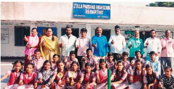
మద్దూర్/మేజర్ న్యూస్: మద్దూరు మండల కేంద్రంలో నిర్వహించిన సీఎం కమ్ క్రీడా పోటీల్లో విజయం సాధించిన మండలంలోని రేబర్తి గ్రామ జిల్లా