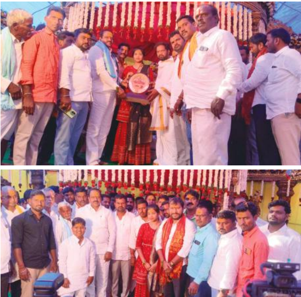
నారాయణఖేడ్ మేజర్ న్యూస్: నారాయణఖేడ్ నియోజకవర్గం మండల్ అసంతసాగర్ గ్రామంలో ఆదివారం అంగరంగ వైభవంగా నిర్వహిస్తున్న