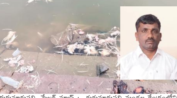
కుకునూరుపల్లి, మేజర్ న్యూస్ : కుకునూరుపల్లి మండల కేంద్రంలోని

- మత్స్య సంపదకు ముప్పు - పలుమార్లు హెచ్చరికలు జారీ చేసిన చికెన్ సెంటర్ల యజమానుల మారని వైసం