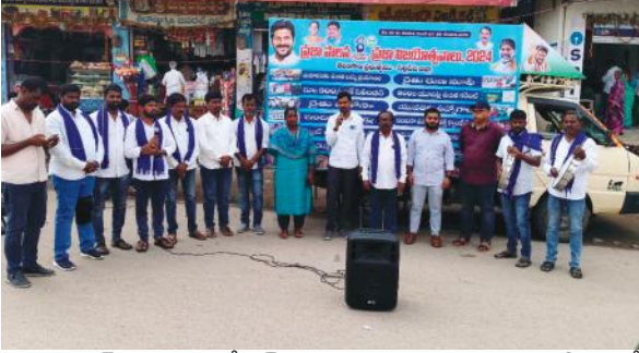
దుబ్బాక అర్ సి. సూర్య మేజర్ న్యూస్: రాష్ట్ర ప్రభుత్వం ప్రజా పాలనలో చేపట్టిన అభివృద్ధి సంక్షేమ పథకాలపై జిల్లా సమాచార పౌర సంబంధాల