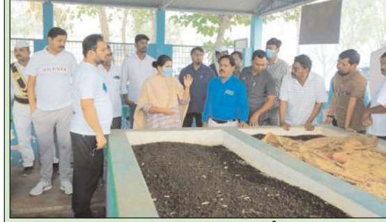
ఉమ్మడి నల్గొండ జిల్లా ట్యూర్

డంపింగ్ యార్డుల ద్వారా సాధ్యమైనంత ఎక్కువ వర్ష కంపోస్టు తయారీకి కేపుషీ చేయాలని జిల్లా కలెక్టర్ ఇలా ప్రతిపాది అన్నారు.