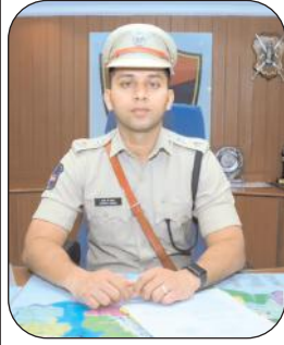
నల్గొండ జిల్లా ట్యూర్

ఈ నెల 15, 16వ తేదీల్లో జరిగే గ్రూప్-2 రాత పరీక్షా కేంద్రాల వద్ద ఎలాంటి అవాంఛనీయ సంఘటనలు చోటు చేసుకోకుండా పోలీసు శాఖ అన్ని రకాల పటిష్ట భద్రతా ఏర్పాట్లు చేయడం జరిగిందని జిల్లా ఎస్సీ ఒక ప్రకటనలో తెలిపారు. నల్గొండ జిల్లాలో గ్రూప్-2 పరీక్షలకు 29118 మంది అభ్యర్థులు హాజరవుతున్నారని, ఇందుకుగాను నల్గొండ లో 59, మిర్యాలగూడ పట్టణంలో 28, మొత్తం 87 పరీక్ష కేంద్రాలు ఏర్పాటు చేస్తున్నట్లు ఆయన తెలిపారు. నల్గొండ నుండి 21,777 మంది అభ్యర్థులు, మిర్యాలగూడ నుండి 7941 మంది మొత్తం 29118 మంది అభ్యర్థులు పరీక్షలకు హాజరుకానున్నారని తెలిపారు. ఈ పరీక్షా కేంద్రాల వద్ద ఉదయం 6 గంటల నుంచి సాయంత్రం 8 గంటల వరకు 163 బి.ఎన్. యస్.యస్ (144 సెక్షన్) అమలులో ఉంటుందని తెలిపారు. పరీక్ష కేంద్రాల సమీపంలో ఉన్న అన్ని జిరాఫ్ సెంటర్స్, ఇంటర్ నెట్ సెంటర్స్, చుట్టుపక్కల లౌడ్ స్పీకర్లు, మూసి వేయాలని, పరీక్ష సెంటర్స్ వద్ద నుండి 500 మీటర్ల వరకు ప్రజలు గుమ్మిగూడవద్ద అని, పరీక్షలకు పటిష్టమైన బందోబస్తు ఏర్పాటు చేయడం జరుగుతుందన్నారు. పరీక్షకు హాజరయ్యే అభ్యర్థులు హాల్ టికెట్ నందు పొందుపరిచిన విధంగా సమయానికి చేరుకోవాలని అన్నారు. అభ్యర్థులు తమ వెంట పరీక్షా హాల్లోకి సెల్ ఫోన్లు, ట్యాబ్, పెన్ డ్రైవ్, బ్లూటూత్, ఎలక్ట్రానిక్ వాచ్, కాలిక్యులేటర్లు, వాలెట్లు, వంటివి తీసుకువెళ్లడానికి అనుమతి ఉండదని చెప్పారు. పరీక్ష కేంద్రంలోకి వెళ్లే ముందే ప్రధాన గేట్ వద్ద తనిఖీలు నిర్వహించే పోలీసు వారికి సహకరించగలరని పేర్కొన్నారు.