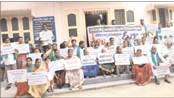
లోని భూముల బహిరంగ మార్కెట్ ధర ఎకరానికి 1 నుండి 5 కోట్లు, ప్లాట్లు గజానికి 20000 ఉంటే ప్రభుత్వం కేవలం 10% నష్టపరిహారం ఇస్తున్నట్లు తెలిపారు. వెంటనే జిల్లా కలెక్టర్ స్థానిక ఎమ్మెల్యే మంతులు, భూ నిర్వాసితుల రైతుల కూర్చోని గ్రామ సభలు నిర్వహించి నిర్వాసితులను అభిప్రాయాన్ని సేకరించి తర్వాతనే భూ సేకరణ పత్రాలపై సంతకాలు చేయాలని ఆల్టిమేట్ కోరారు. ఈ కార్యక్రమంలో భూ నిర్వాసితుల బాధితులు పాల్గొన్నారు.