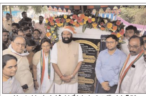
రహదారి పనులకు శంకుస్థాపన చేస్తున్న మంత్రి ఉత్తమ్ కుమార్ రెడ్డి, పక్కన ఎమ్మెల్యే పద్మావతి రెడ్డి, కలెక్టర్ తేజన్ నందాలాల్ పవర్.

కోదాడ, మేజర్ న్యూస్ : ప్రభుత్వ నిధులతో చేపడుతున్న పనులలో నాణ్యత ప్రమాణాలను పాటించాలని, ఎక్కడైనా నిర్మాణాలలో లోపాలు ఉంటే అధికారులు, గుత్తేదారులదే బాధ్యత అని భారీ నీటిపారుదల పౌరసరపాల శాఖ మంత్రి ఉత్తమ్ కుమార్ రెడ్డి అన్నారు. సోమవారం కోదాడ నియోజకవర్గం లోని మోతే, నడిగూడెం, మునగాల, అనంతగిరి, కోదాడ పట్టణం, చిలుకూరు మండలాలలో 100 కోట్లకు పైగా నిధులతో రహదారుల అభివృద్ధి పనులకు, ఆర్ అండ్ బి గెస్ట్ హౌస్, ఆర్ అండ్ బి కార్యాలయాలకు స్మిల్ డెవలప్ మెంట్ కేంద్రానికి, ఎమ్మెల్యే పద్మావతి రెడ్డితో కలిసి శంకుస్థాపనలు చేశారు. అనంతరం మంత్రి ఉత్తమ్ మాట్లాడుతూ కోదాడ నియోజకవర్గ సర్వతో ముఖాభివృద్ధి మా లక్ష్యమని అన్నారు.