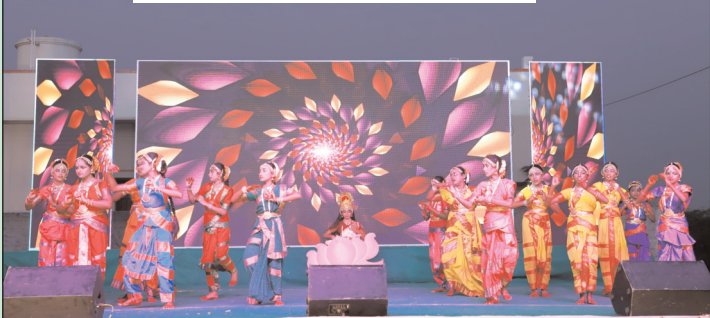
విద్యార్థులు నిర్వహిస్తున్న సంస్కృతిక కార్యక్రమాలు