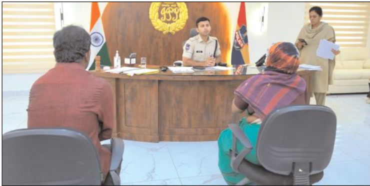
నల్గొండ జిల్లా ట్యూర్

ప్రతి సోమవారం ప్రజల సౌకర్యార్థం నిర్వహించే గ్రీవెన్స్ డేలో బాగంగా సోమవారం జిల్లా పోలీసు కార్యాలయంలో జిల్లాలోని వివిధ ప్రాంతాల నుండి వచ్చిన దాదాపు 35 మంది అర్జీదారులతో నేరుగా మాట్లాడి తమ సమస్యలను తెలుసుకొని సంబంధిత అధికారులతో ఫోన్ లో మాట్లాడి పూర్తి వివరాలు సమర్పించాలని ఆదేశించారు. ఈ సందర్భంగా మాట్లాడుతూ ప్రజలకు పోలీస్ శాఖను మరింత చేరువ చేయడం లక్ష్యంగా ప్రజా సమస్యలను పరిష్కరించే విధంగా కృషి చేస్తున్నామని అన్నారు. బాధితుల సమస్యలు తక్షణ పరిష్కారానికి చర్యలు తీసుకోవాలని, పోలీస్ స్టేషన్ కి వచ్చిన ఫిర్యాదుదారులతో మర్యాదగా మాట్లాడి వివరాలు స్వీకరించి సంబంధిత ఫిర్యాదులపై క్షేత్ర స్థాయిలో పరిశీలించి వేగంగా స్పందించి చట్ట పరంగా బాధితులకు న్యాయం జరిగే విధంగా చూడాలని, ఫిర్యాదుదారునికి భరోసా, నమ్మకం కలిగించాలని అన్నారు. ఎవరైనా చట్టవ్యతిరేకమైన చర్యలు చేస్తూ శాంతి భద్రతలకు భంగం కలిగించే వారి పట్ల కఠినంగా వ్యవహరించాలని అన్నారు. బాధితుల యొక్క ప్రతి ఫిర్యాదును ఆన్లైన్లో పొందుపరుస్తూ నిత్యం పర్యవేక్షణ చేస్తున్నట్లు తెలిపారు.