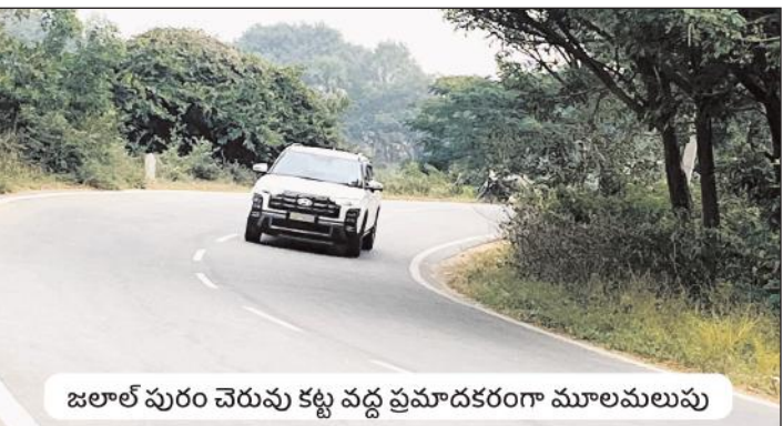
జలాల్ పురం చెరువు కట్ట వద్ద ప్రమాదకరంగా మూలమలుపు

భూదాన్ పోచంపల్లి, మేజర్ న్యూస్ : భూదాన్ పోచంపల్లి అంతర్జాతీయ గ్రామీణ పర్యాటక గ్రామం. చేనేత ఇక్కడ వస్త్రోత్పత్తికి ప్రసిద్ధికావడంతో హైదరాబాదుకు కూతవేటు దూరంలో ఉండడంతో నిత్యం వివిధ ప్రాంతాల నుంచి పర్యాటకులు, చేనేత వస్త్రాలను కొనుగోలు చేసేవారు, వ్యాపారులు వస్తుంటారు. ఈ రహదారిపై వాహనాల రద్దీ ఉంటుంది. అయితే ఈ రహదారిపై జలాల్ పురం చెరువు కట్ట వద్దకు రాగానే ఇరువైపులా ప్రమాదకర మూలమలుపులు ఉన్నాయి. ఇరువైపులా చెట్లు, పొదలు దట్టంగా పెరిగి రోడ్డు ఇరుకుగా ఉండటంతో ఎదరుగా వచ్చే వాహనాలు దగ్గరికి వచ్చేంత వరకు సరిగా కనిపించవు. చెరువుకు గ్రీలింగ్ (రక్షణ కవచం) గోడ లేకపోవడంతో ప్రమాదాలకు కారణమవుతున్నాయి. ఇప్పటికైనా అధికారులు స్పందించి మూలమలుపుల సమీపంలో సూచిక బోర్డులు, స్పీడ్ బ్రేకర్లు, చెరువుకు గ్రీలింగ్, రక్షణ గోడ ఏర్పాటుచేయాలని డిమాండ్