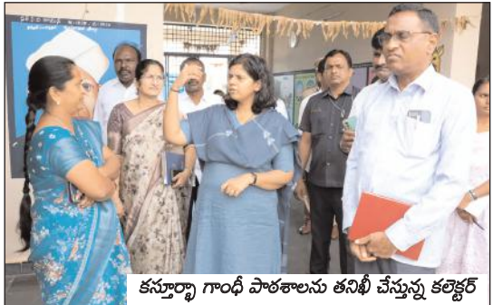
కస్తూర్బా గాంధీ పాఠశాలను తనిఖీ చేస్తున్న కలెక్టర్

కస్తూర్బా గాంధీ పాఠశాలను ఆకస్మిక తనిఖీ చేసిన కలెక్టర్ ఇలా త్రిపాఠి