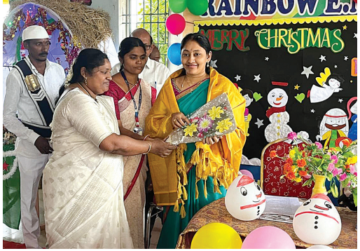
నన్నారు. అనంతరం క్రైస్తవ పెద్దలు ఆత్మీయ పరస్పర ప్రేమా భిక్షనాలతో జీవనం స్వాగతం పలికి ఘనంగా సన్మానించారు. రెయిన్ సాగించాలని కోరారు.