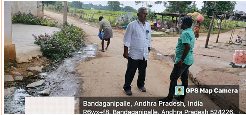
Bandaganipalle, Andhra Pradesh, India R6wx+f8, Bandaganipalle, Andhra Pradesh 524226