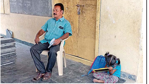
ఒక్క విద్యార్థితో సాగిన ఎల్ ఆర్ పల్లి ఉర్ధ్వప్రాథమిక పాఠశాల

కన్పిస్తున్నారు. అత్యుక్తారు మండలంలో ఉన్నత, ప్రాథమికోన్నత, ప్రాథమిక పాఠశాలలు 76కాగా 2021-22లో 5503మంది విద్యార్థులు కాగా 2022-23లో 5126మందిగా, ఈడపా 4481మంది విద్యార్థులున్నారు. ఏటా ఎన్నెన్నో కోట్ల రూపాయలతో అనేక కార్యక్రమాలు అమలుచేస్తున్న ప్రయోగాలు చేస్తున్నా విద్యార్థుల సంఖ్య తగ్గుతూనే ఉండగా ఒక్క అత్యుక్తారు మండలంలోనే రెండు పాఠశాలల్లో సున్ననమోదు, 10మందికన్నా విద్యార్థులన్న పాఠశాలలు 10 కాగా 25మందికన్నా తక్కువగా 22పాఠశాలలుండడం గమనార్హం, ముగ్గురు, నలుగురు, ఐదుమంది విద్యార్థులన్నచోట వారు ఖచ్చితంగా ఆ పాఠశాలలో చదివేవారేనా, పాఠశాల ఉనికికోసం ఒకటి, రెండు పేర్లు తూతూమంత్రంగా నమోదు చేశారా అనే సందేహంకూడా ఉంది. పలు ప్రాథమిక పాఠశాలల్లోనుండి 3, 4, 5 తరగతుల విద్యార్థులను సమీప ఉన్నత పాఠశాలలకు పంపినా అక్కడ వారికి ప్రత్యేకంగా ఉపాధ్యాయులను మాత్రం నియమించలేదు. ఉన్నత పాఠశాలలో జూనియర్ కాలేజీ అని ప్రకటించిన ప్రభుత్వం అత్యుక్తారులో రెండేళ్ళ క్రితం ఒక మహిళాజూనియర్ కాలేజీని ప్రారంభించి ఒక్కరినికూడా సిబ్బందిని, అధ్యాపకులను నియమించనందున ఉన్నత పాఠశాల ఉపాధ్యాయులే బోధించగా ప్రభుత్వం తమ ప్రయోగం ఏఫలమైందని భావించి కాలేజీని మూసివేశారు. ఈసూతన ప్రభుత్వం గత చట్టాలను పున:పరిశీలించాలని, కొన్నింటిని రద్దుచేయాలని, అస్థవ్యస్థంగా మారిన విద్యావ్యవస్థను సక్రమబాటలోకి తేవాలని, విద్యార్థులు అధికంగా కోట్లాదిరూపాయలు వెచ్చించే ప్రభుత్వ పాఠశాలల్లో చేరాలా చూడాలని సర్వత్రా అభిప్రాయపడుతున్నారు.