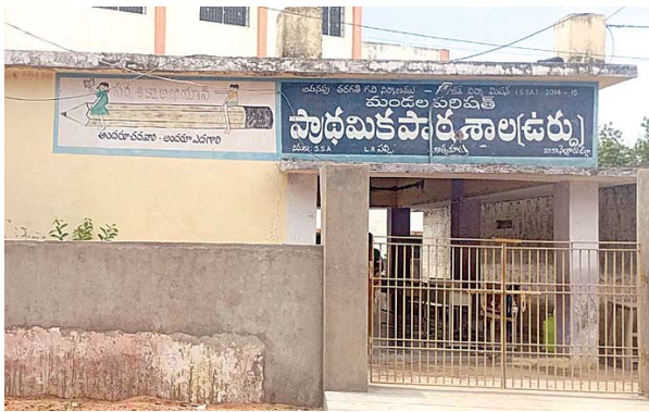
ముగ్గురు విద్యార్థులున్న ఉర్ధ్వపాఠశాల భవనం

అత్యుక్తారు, మేజర్స్ న్యూస్ : ప్రాథమిక విద్యను బలోపేతం చేస్తాం.. విద్యార్థుల ఉజ్వలభవిష్యత్తుకు ప్రాథమిక దశలోనే పునాదులు వేస్తాం.. ఆంగ్లమాధ్యమం ప్రవేశపెడుతున్నాం, చిన్నారలందరినీ సర్కారుబడులకు రప్పిస్తాం.. అమృతబడి, మధ్యాహ్నం భోజనం, విద్యాదీవెన, విద్యాకాసుక, యూనిఫారం దుస్తులు, బూట్లు, ట్రెలు, పాఠ్యపుస్తకాలు ఉచితంగా ఇస్తాం అంటూ ఎన్నెన్నో ప్రయోగాలను వైసీపీ ప్రభుత్వం అమలుచేసినా తీరా చూస్తుంటే ఏపటికావిదు ప్రభుత్వ పాఠశాలల్లో విద్యార్థుల సంఖ్య గణనీయంగా తగ్గింది. తల్లిదండ్రులు కాన్వెంట్లపై మోజు పెంచుకుంటున్నారు. అత్యుక్తారు మండలంలో గత 2విద్యాసంవత్సరాలు, ఈ విద్యాసంవత్సరం పరిశీలిస్తే విద్యార్థుల సంఖ్య పెరగకపోగా తగ్గిపోయింది. గత ప్రభుత్వ హయాంలో తరగతుల విలీనం, కొత్తతరగతుల ఏర్పాటు తదితర కారణాలతో విద్యావ్యవస్థ అస్థవ్యస్థంగా మారింది. తాజా తెలుగుదేశం ప్రభుత్వం ప్లస్ టు రద్దు, తరగతుల విలీనం రద్దు తదితర నిర్ణయాలను తీసుకుంటుండడంతో ఇకనైనా విద్యావ్యవస్థ గాడినపడుతుందా అని జనాలు కొండంత ఆశతో ఎదురుచూస్తున్నారు. అత్యుక్తారు మండలంలో ఈ విద్యాసంవత్సరం పరిశీలిస్తే ఉన్నతపాఠశాలలు 13, ప్రాథమిక, ప్రాథమికోన్నత పాఠశాలలు 63 ప్రభుత్వపరంగా ఉన్నాయి. ఈ విద్యాసంవత్సరం ఆరంభమై అడ్మిషన్లు పూర్తయ్యాక పరిశీలించగా ఈ 76 పాఠశాలల్లో 1నుండి 10 తరగతుల విద్యార్థుల సంఖ్య 4483గా ఉండగా 13 ఉన్నత పాఠశాలల్లో 2817మంది విద్యార్థులు కాగా మిగతా 63 ప్రాథమిక పాఠశాలల్లో కేవలం 1664మంది మండలంలో మాత్రమే ఉన్నారు. సగటున ఒక పాఠశాలకు 26.4మంది ఉన్నారు. మండలంలోని ఆరవేడుజంగాలపల్లి, అల్లీపరం