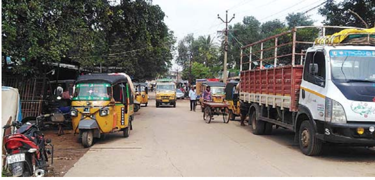
ఆత్మకూరు పట్టణంలో రోడ్డుపైనే వాహనాలకు మరమ్మత్తులు చేస్తున్న దృశ్యం

ఆత్మకూరు, మేజర్స్ న్యూస్ : ఆత్మకూరులో ఆటోకార్మికులు 16 ఏళ్లుగా అరిచి గీపెడు తున్నా ఆటోనగర్ కల కలగానే మిగలడం, శంఖుస్థాపన చేసినా అతీగతీ లేకపోవడం తో ఆత్మకూరు పట్టణంలో వారి అవస్థలు వర్తనాతీతంగా ఉండగా జనాలకు అసౌకర్యం కూడా అదేతరహాలో ఉంది. రోడ్డుకి రువైపులా వాహనాలను నిలిపి మరమ్మత్తులు చేసుకుంటుండగా ఆమార్గాన వెళ్లే ప్రజలు మాత్రం తీవ్రంగా ఇబ్బంది పడుతున్నారు. ఎన్నిదరాలు ఈవిషయమై మేజర్స్ న్యూస్ అధికారుల దృష్టికి, పాలకుల దృష్టికి తీసుకెళ్ళినా స్పందన కరువైంది. ఇక ఆటోనగర్ హుక్ కేనా, రోడ్డుపైనే వాహనాల మరమ్మత్తులు సాగాల్సిందేనా, గతంలో చేసిన పోరాటాలు వృధాయేనా, భూమిపూజ చేసినా ఫలితం శూన్యమేనా, ప్రజల అగచాల్లు కొనసాగాల్సిందేనా అని పలువురు ప్రశ్నిస్తున్నారు. ఆత్మకూరు నడిబండన