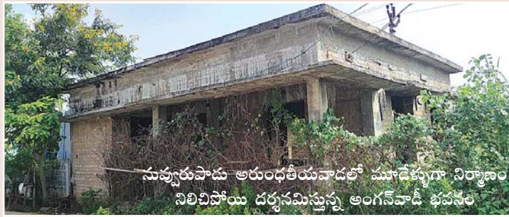
సువ్వరుపాడు అరుంధతీయవాడలో మూడేళ్ళుగా నిర్మాణం నిలిచిపోయి దర్శనమిస్తున్న అంగన్ వాడీ భవనం

ఆత్మకూరు, మేజర్స్ న్యూస్ : ఆత్మకూరులో నిధులకొరత అని, ఇతరత్రా కారణాలని అనేక భవనాల నిర్మాణాలు అర్ధాంతరంగా నిలిచిపోయి దర్శనమిస్తుండడం, పూర్తియిన భవనాలు వివిధ కారణాలతో వినియోగంలో లేకుండా నిరుపయోగంగా దర్శనమిస్తుండడం అనాదిగా ఆనవాలుతీగా ఉంది. మండలంలోని సువ్వరుపాడు అరుంధతీయకాలనీలో గత మూడేళ్లుగా ముళ్ళచెల్ల మద్ద్య ఒక అర్ధాంతరనిర్మాణ భవనం కనిపిస్తుంటుంది. అది అంగన్ వాడీ భవనమని, శ్లాబ్ లెవల్ వరకు నిర్మించి వదిలేశారని కాలనీవాసులు తెలిపారు. సువ్వరుపాడు, మహిమలూరు, అప్పారావుపాకెం, నాగులపాడు, చెర్లొయడపల్లి, సాతానుపల్లి, శ్రీనివాసపురం, పమిడిపాడుల్లో కూడా అదేమాదిరిగా భవనాల నిర్మాణాలు నిలిచిపోయి ఉన్నాయని ఆయా గ్రామాల వారు చెబుతుండేవారు. అప్పట్లో ఒక్కో భవనానికి 7లక్షల రూపాయలవంతున మంజూరు కాగా శ్లాబ్ లెవల్ వరకు నిర్మించి వదిలేశారని చెబుతుండేవారు. ఆత్మకూరులో పలు భవనాల పరిస్థితి చూస్తే అత్యంత విద్వేషంగా, విచిత్రంగా ఉంటుంది. 9 సంవత్సరాలుగా ఆర్అండ్ బి అతిధిగృహం భవనం, ఐదేళ్ళుగా ఆర్డీవో, తహశీల్దారు కార్యాలయాల భవనాల నిర్మాణాలు ఇంకా సాగుతూనే ఉన్నాయి. సాతానుపల్లి వద్ద నిర్మించిన పాఠశాల భవనం, కమ్యూనిటీహాల్ నిర్మాణం పూర్తయినా నిరుపయోగంగా ఉన్నాయి. మహిమలూరులో డ్యూకా భవనం 12 సంవత్సరాలుగా శ్లాబ్ లెవల్ లో దర్శనమిస్తోంది. ఈవిషయమై అధికారులతో మేజర్స్ న్యూస్ మాట్లాడగా ప్రాజెక్ట్ పరిధిలో దాదాపు 20 భవనాలు ఇలాగే ఉన్నాయని, నిధులు కొరతతో పనులు నిలిచిపోయాయని తెలుపగా తమవంతుగా ఏమీ ద్వారా ఏమీ భవనానికి ఎంత నిధులు అవసరమో అంచనాలు వేయించి ఉన్నతాధికారులకు ప్రతిపాదనలు పంపామని, ఇంకా నిధులు మంజూరు కాలేదని వారు పేర్కొన్నారు. మరి జిల్లా అధికారులు స్పందించి నిధులు మంజూరుకు చర్యలు తీసుకుంటారేమో చూడాలి ఉంది.