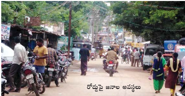
రోడ్డుపై జనాల అవస్థలు

బిఎస్ఆర్ సెంటరు నుండి మండలపరిషత్, పంచాయతీరాజ్, ఆర్డబ్ల్యుఎస్, ఎంఐఎస్, ఎక్సైజ్, వెలుగు, ఎన్ఆర్ఈజీఎస్, తదితర కార్యాలయాలు, ప్రభుత్వ జూనియర్ కాలేజి, హైస్కూలు, బాలికోన్వత్త పాఠశాల, వివిధ ప్రవేటు విద్యాసంస్థలకు వెళ్ళే రహదారికి ఇరువైపులా ఆటోవర్కౌపులను కార్మికులు ఏర్పాటు చేసుకొని తమ బ్రతుకు దెరువు అనాదిగా సాగిస్తున్నారు. ఈమార్గంలో వాహనాలను నిత్యం రోడ్డుపై అడ్డంగా పెట్టి మరమ్మత్తులు చేస్తుంటారు. అదిగాక వెల్డింగ్ పనులు కూడా చేస్తుంటారు. ఈ పరిస్థితి అధికారులు, ఉద్యోగులు, ప్రజాప్రతినిధులు, విద్యార్థులు, ఉపాధ్యాయులు, అధ్యాపకులు, క్రిస్టియన్ పేట, మేదరవీధి తదితర ప్రాంతాల ప్రజలు తీవ్రంగా ఇబ్బంది పడుతుండేవారు. వెల్డింగ్ పనుల వలన కళ్ళకు ఇబ్బందికలుగుతుందని కూడా ఆందోళన చెందుతుండేవారు. 15 సంవత్సరాల