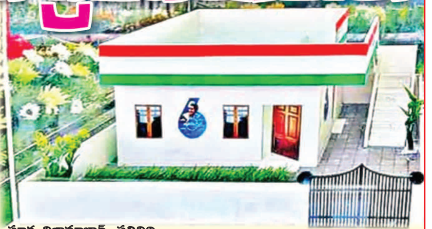
సూర్య నిజామాబాద్ ప్రతినిధి

కాంగ్రెస్ అధికారం చెపట్టిన తర్వాత ప్రజాపాలనలో లబ్ధిదారులు అడిగిన వారికే ఇందిరమ్మ ఇండ్లు మంజూరు చేస్తారు. ఇంకా పేదలు మిగిలుంటే తర్వాత ఎంపిక చేస్తామని చేస్తున్నారు. నిరుపేదలయ్యి ఉండి గతంలో ఇంటి నిర్మాణం కోసం సహకారం తీసుకోకుంటేనే ఇప్పుడు ఎంపిక చేయబడతారు. ఇల్లు నిర్మాణంలో ఉన్నారేషన్ కార్డు లేని వారిని యాప్ తిరస్కరిస్తుందని తెలియడంతో లబ్ధిదారులు ఆందోళన వ్యక్తం చేస్తున్నారు. ఇందిరమ్మ లబ్ధిదారుల ఎంపిక పారదర్శకంగా చేయాలని అర్జులయిన ప్రతి ఒకరికీ లబ్ధి చేకూరేలా చర్యలు తీసుకోవాలని రాజకీయ పార్టీలు కోరుతున్నారు.