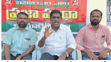
ఉపాధికూలీలు కాకుండా వ్యవసాయ రంగంలో కూడా అనేక పనులు చేసే కూలీలు ఉన్నారు అని వీరికి కూడా ఆసరా భృతిని అందించాలి అని ఆయన డిమాండ్ చేశారు. రాష్ట్రంలో 51 లక్షలు ఉన్నాయని ప్రభుత్వమే చెప్పింది అని కానీ 100రోజులు పని చేసిన వారికే ఇవ్వాలని, భూమిలేని కూలీలకే ఇస్తాం అనడమంటే కూలీలకు మొండి చెయ్యి చూపడమేనన్నారు. వందరోజులు ఉపాధి పనిచేసినవారు 25వేలు