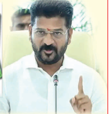
సూర్య నిజామాబాద్ బ్యూరో

- కొత్త రెవెన్యూ చట్టంతో రైతుల సమస్యలకు సత్వర పరిష్కారం - హక్కులు లేక సాదాబైనామీ దారుల ఇబ్బందులు 2 లో