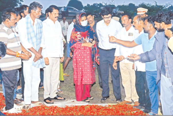
కోవాలని సిబ్బందిని ఆదేశించారు. మాట్లాడుతూ గ్రామస్థాయిలో ఈ సందర్భంగా జిల్లా కలెక్టర్ మిగతా 3లో