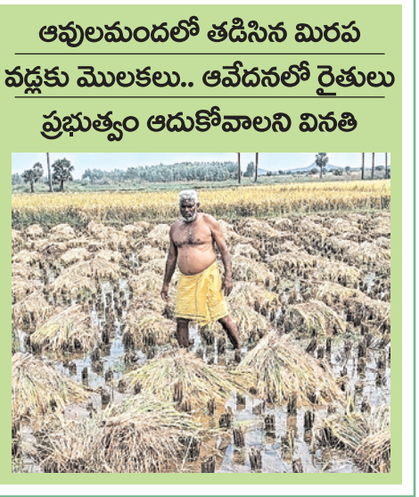
ఆవులమందలో తడిసిన మిరప వడ్లకు మొలకలు.. ఆవేదనలో రైతులు ప్రభుత్వం ఆదుకోవాలని వినతి

సూర్య ప్రతినిధి, ఒంగోలు ఆరుగాలం కష్టించి పంటలు పండించిన అన్నదాతలకు గత మూడు రోజులుగా కురుస్తున్న వర్షాలతో విలవిలలాడుతున్నారు. పంట చేతికి వచ్చిన సమయానికి కురిసిన వర్షం దెబ్బకు లబ్ధిలోమంతున్నారు. చేతికి రావలసిన పంటలు నీట మునగడంతో ఆవేదన చెందుతున్నారు. కురిచేడు మండలంలోని ఆవుల మంద గ్రామంలో మిరప, వరి పంటలకు తీవ్ర నష్టం వాటిల్లడంతో రైతులు దిక్కుతోచని దయనీయ స్థితిలో పడ్డారు. అప్పుల పాలు చేసి సాగు చేశామని పంట చేతికందే మిగతా 3లో