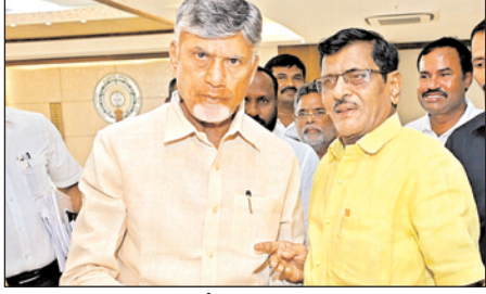
అంకిత భావంతో పనిచేస్తూ వచ్చానని, దాదాపుగా 40 సార్లు వివిధ అసెంబ్లీ, పార్లమెంటు నియోజక వర్గాలకు పార్టీ పరిశీలకులుగా వెళ్లి పార్టీ అభివృద్ధికి కృషి చేశానని, ప్రభుత్వ నామినేటెడ్ పదవుల్లో తనకు అవకాశం కల్పించాలని పార్టీ పరిశీలకులు శాసనాల వీరబ్రహ్మం ముఖ్యమంత్రి చంద్రబాబును కోరారు.

మార్కాపురం, మేజర్ న్యూస్: రాష్ట్ర ముఖ్యమంత్రి నారా చంద్రబాబు నాయుడును టిడిపి రాష్ట్ర పరిశీలకులు, జిల్లా పార్టీ అధికార ప్రతినిధి శాసనాల వీరబ్రహ్మం బుధవారం సాయంత్రం అమరావతి లోని సెక్రటేరియట్ బ్లాక్-1లోని ఆయన కార్యాలయంలో మర్యాదపూర్వకంగా కలిశారు. ఈ సందర్భంగా పశ్చిమ ప్రకాశానికి వర ప్రసాదమైన పూల సుబ్బయ్య వెలిగొండ ప్రాజెక్టు నిర్మాణ పనులకు రూ 2,000 కోట్ల నిధులను మంజూరు చేయాలని, నిర్మాణంలో ఉన్న మెడికల్ కళాశాలను పూర్తిచేసి ఈ ప్రాంత రోగులకు మెరుగైన వైద్య సేవలు అందించాలని, అన్ని రంగాల్లో వెనుకబడిన పశ్చిమ ప్రకాశం ప్రజల చిరకాల వాంఛ అయిన మార్కాపురాన్ని జిల్లా కేంద్రంగా ప్రకటించాలని కోరుతూ వినతి పత్రం సమర్పించారు. అలాగే తాను పార్టీ ఆవిర్భావం నుండి గత 42 సంవత్సరాలుగా