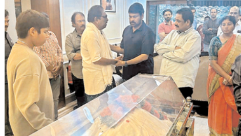
రామచంద్రయ్య, కదిరి బాబురావులను పరామర్శిస్తున్న మెగాస్టార్ చిరంజీవి