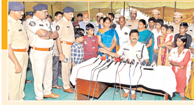
గత ఆరు నెలల్లో 367 మిసింగ్ కేసులు బాల బాలికలు, మహిళలను కుటుంబ సభ్యులకు అప్పగించిన జిల్లా పోలీసులు