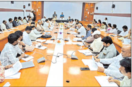
రాకుండా చర్యలు తీసుకోవాలన్నారు. విద్యార్థులు వారి తల్లిదండ్రులు పాఠశాల ప్రాంగణంలోకి రాగానే

ఎక్కడికి వెళ్లాలి, సీఎం వచ్చే మార్గాలకు సూచిక బోర్డులను ఏర్పాటు చేయాలన్నారు. 919 మంది విద్యార్థులు ఉండగా, వారితోపాటు తల్లిదండ్రులు మాత్రమే కార్యక్రమానికి హాజరయ్యేలా చూడాల్సిన బాధ్యత అధికారులపై ఉందన్నారు. అరటి తోరణాలు ఏర్పాటు చేయాలన్నారు. విద్యార్థుల సమగ్ర ప్రగతి పత్రాలపై తల్లిదండ్రులతో చర్చించే అంశానికి ఎలాంటి విఘాతం ఏర్పడకుండా చూడాలన్నారు. తల్లిదండ్రులతో ఉపాధ్యాయులు నిర్వహించే సమావేశంలోనే రాష్ట్ర ముఖ్యమంత్రి హాజరవుతారని వివరించారు. విద్యార్థుల తల్లిదండ్రులకు ప్రాధాన్యత ఇవ్వాలన్నారు. సీఎం పర్వటన