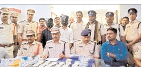
దగ్గామిట్లలో ఎలక్ట్రానిక్స్ దుకాణం, మంగళగిరిలో షిఫ్ట్ కారు, పినుకొండలో ఆటోమొబైల్స్ దుకాణం, పొదిలిలో ఎలక్ట్రికల్ దుకాణం, పర్చూరులో రెండుకిరాణి దుకాణాలు, రెండు చరవాణి దుకాణాల్లో దొంగతనాలు జరిగాయి. గతనెల 25వ తేదీన అద్దంకి పోతురాజు గండిలోని శ్రీరామ్ ఏజెన్సీలో షట్టర్ పగులగొట్టి దొంగతనాలకు పాల్పడ్డారు. చరవాణి ఆధారంగా కేసు దర్యాప్తు... నిందితుడు ఉపయోగించిన చరవాణి ఆధారంగా