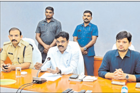
ప్రతిష్టమైన భద్రత కల్పించాలన్నారు. పాఠశాలకు నాలుగు గేట్లు ఉన్నందున ఇతరులు లోపలికి