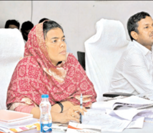
వస్తున్న ఫిర్యాదులను క్షుణ్ణంగా పరిశీలించాలని కలెక్టర్ చెప్పారు. ఆ భూముల స్వభావాన్ని బట్టి బాధ్యులకు చట్ట ప్రకారం నోటీసులు ఇచ్చి కాపాడాలన్నారు. కేవలం నోటీసులు ఇచ్చి

ప్రజల ఫిర్యాదులకు శాశ్వత పరిష్కారం చూపాలి వీడియో కాన్ఫరెన్స్ లో కలెక్టర్ ఏ.తమిమ్ అన్సారియా అధికారులకు ఆదేశం ఒంగోలు, మేజర్ న్యూస్ : భూ కబ్జాలు, ఆక్రమణలపై ఉక్కుపాదం మోపాలని జిల్లా కలెక్టర్ ఏ. తమిమ్ అన్సారియా స్పష్టం చేశారు. రెవెన్యూ, హైకోర్టు కేసులు, 'మీకోసం' అర్థిల పరిష్కారంపై మంగళవారం ఆమె కలెక్టరేట్ నుంచి జాయింట్ కలెక్టర్ ఆర్. గోపాలకృష్ణతో కలిసి సబ్ కలెక్టర్, ఆర్.డి.ఓలు, తహశీల్దార్లతో వీడియో కాన్ఫరెన్స్ నిర్వహించారు. రెవెన్యూకు సంబంధించి గ్రేడ్స్, పత్రికా కథనాలతో పాటు సుమోట్ గా ఆయా అంశాలను చేపట్టి వాటి సత్వర పరిష్కారానికి చర్యలు తీసుకోవాలని ఆమె ఆదేశించారు. ప్రభుత్వ, ప్రైవేటు, అప్రెన్స్ భూముల కబ్జా, ఆక్రమణలకు సంబంధించి