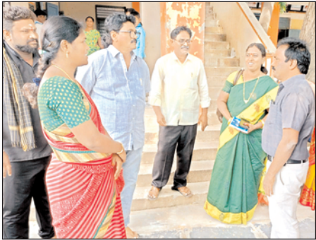
మంజూరు చేసింది. ఒక్కొక్క గ్రూపునకు సుమారు 34 మంది విద్యార్థులు ఉన్నారు. వీరికి పాఠాలు బోధించడానికి ఆగస్టు ఒకటి నుండి ప్రభుత్వం వర్క్ అడ్జస్టెంట్ కింద సర్

కొత్తపట్నం, మేజర్ న్యూస్: జిల్లా పరిషత్ ఉన్నత పాఠశాలను 2024 విద్యా సంవత్సరానికి హైస్కూల్ ప్లస్ గా ఉన్నతీకరణ చేస్తూ ప్రభుత్వం నిర్ణయం తీసుకోవడంతో గ్రామీణ ప్రాంత విద్యార్థులు ఇంటర్మీడియట్ చదువుకోవడానికి అవకాశం కల్పించింది. అయితే వారికి సబ్జెక్టుల బోధనకు మాత్రం ప్రత్యేకంగా లెక్చర్లను నియమించకుండా ఎస్జిటీలు, సర్ ప్లస్ లో ఉన్న స్కూల్ అసిస్టెంట్లతో బోధించడం ఎంతవరకు సమంజసమనీ తల్లిదండ్రులు ప్రశ్నిస్తున్నారు. కొత్తపట్నం హైస్కూల్లో జూలై 1 నుండి సెక్షన్ కు 40 చొప్పున ఎంపీసీ సీకస్ రెండు గ్రూపులను