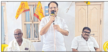
తీసుకుంటానన్నారు.అలాగే త్వరలో జరగబోయే సాగునీటి సంఘాల ఎన్నికలు,సాపైటి ఎన్నికలను అందరూ మాట్లాడుకుని ఏకగ్రీవాలు అయ్యే విధంగా చూసుకోవాలి తెలియచేశారు.ఈ కార్యక్రమం లో అమర్తలూరు మండలం తెలుగుదేశం పార్టీ నాయకులు,కార్యకర్తలు అధిక సంఖ్యలో పాల్గొన్నారు.