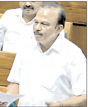
అభివృద్ధి, సమాహిక భాగస్వామ్యం, ప్రతిభను ప్రోత్సహించడం ఖేలో

పార్లమెంట్ లో ఒంగోలు ఎంపి మాగుంట ప్రశ్న ఒంగోలు, మేజర్ న్యూస్ : ఆంధ్రప్రదేశ్ లో ఖేలో ఇండియా పథకం నిర్వహణకు తీసుకుంటున్న చర్యలేవి ఒంగోలు పార్లమెంట్ సభ్యులు మాగుంట శ్రీనివాసులురెడ్డి ప్రశ్నించారు. దేశం, రాష్ట్రంలో ఖేలో ఇండియా (క్రీడల) పథకం కింద క్రీడల మౌలిక సదుపాయాలు, సెంటర్లు, స్టేడియాలు వివరాలు, కేటాయించిన, వాడిన నిధులు, నిర్మాణాలకు, సెంపునకు కేంద్ర ప్రతిపాదనలు గురించి మాగుంట అడిగిన ప్రశ్నకు కేంద్ర యువజన వ్యవహారాల, క్రీడల శాఖ మంత్రి డా. మన్నుక్ మాండవీయ వివరణ ఇచ్చారు. క్రీడల