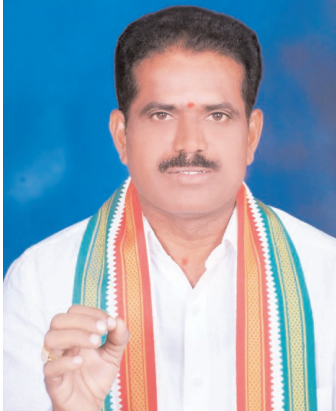
కొందరు సర్వే అధికారులు ఇంటిపన్నులు చెల్లినే మీ పేర్లు ప్రభుత్వానికి పంపి యావ్ లో నమోదు చేస్తామని భయపెడుతున్నట్లు వివిధ గ్రామాల పేదలు