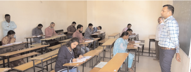
గ్రూప్ 2 సెంటర్స్ను సందర్శించిన కలెక్టర్