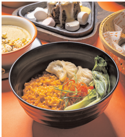
హైదరాబాద్: మేజర్ స్టూన్: ఈ హాల్వీడ్ సీజన్, శీతాకాలపు మాయాజాలాన్ని మరపురాని ఆనందక

-సోషల్ యొక్క ప్రత్యేకమైన వింటర్ మెనూ, పానీయాల ఆఫర్