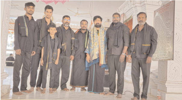
గండిపేట్, మేజర్ న్యూస్ (డిసెంబర్ 18) : అయ్యప్ప స్వాముల మూలధారణ