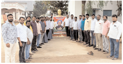
చెన్నారెడ్డి గూడ, బండలేమూర్, జాపాల తదితర