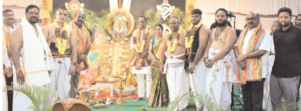
నివాళులు అర్పిస్తున్న దృశ్యం.