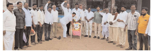
గొప్పవ్యక్తి మన మధ్య లేకపోవడం బాదకం అని అన్నారు. నివాళులు అర్పించిన వారు కాంగ్రెస్ నేతలు ఉన్నారు.

కొందుర్ల, మేజర్ న్యూస్ (డిసెంబర్ 27): మాజీ ప్రధాన మంత్రి మన్మోహన్ సింగ్ సేవలు చిరస్మరణీయం అని పలువురు గుర్తుచేశారు. శుక్రవారం కొందుర్ల మండల కేంద్రంలో కాంగ్రెస్ నాయకులు, యువకులు మన్మోహన్ సింగ్ చిత్ర పటానికి పూలమాల వేసి ఘనంగా నివాళులు అర్పించారు. ఈ సందర్భంగా కాంగ్రెస్ నాయకులు మాట్లాడుతూ... భారతదేశ మాజీ ప్రధాన మంత్రి డాక్టర్ మన్మోహన్ సింగ్ మృతి దేశ, రాష్ట్ర ప్రజలకు తీరని లోటు అని గుర్తుచేశారు. 1987 సంవత్సరంలో పద్మవిభూషణ్ పొందిన భారత ముద్దు బిడ్డ అని స్మరించుకున్నారు. పేద విద్యార్థులకు నాణ్యమైన విద్యను అందించడానికి మోడల్ స్కూళ్ళ ఏర్పాటు కోసం ఎంతో కృషి మహనీయుడు మన్మోహన్ సింగ్ లాంటి