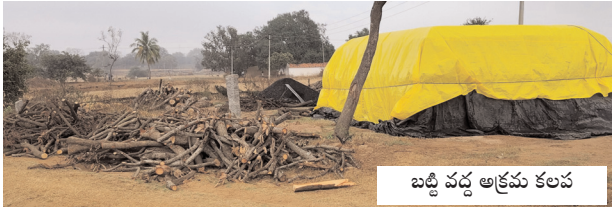
బట్టి వద్ద అక్రమ కలప