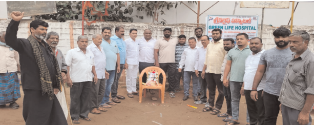
అలియాబాద్ గ్రామంలో మన్మోహన్ సింగ్ చిత్రపటానికి పూలమాల వేసి