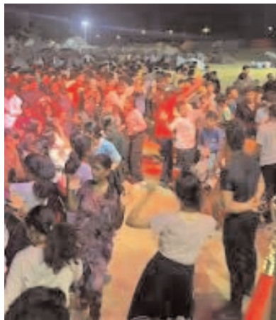
కూడా భారీ శబ్దాలతో ఇష్టానుసారంగా ఈవెంట్ లు నిర్వహించి స్టానికులకు ఇబ్బందులు కలిగిస్తారా.. లేదా పోలీస్ నిబంధనలు పాటించి ప్రశాంత వాతావరణంలో సంబురాలు చేసుకుంటారా వేచి చూడాలి..

● పోలీస్ లకు సవాల్ గా మారిన న్యూ ఇయర్ వేడుకలు వికారాబాద్, మేజర్ న్యూస్ (డిసెంబర్ 30): వికారాబాద్ లో న్యూ ఇయర్ వేడుకలు పోలీస్ లకు సవాల్ గా మారనున్నట్లు తెలుస్తుంది. సర్వీస్ లి, అసంతోగి గుట్టు చుట్టు ఉన్న రీసార్ట్ లలో న్యూ ఇయర్ వేడుకలకు భారీ ఏర్పాట్లు చేసుకున్నారు. తమ వద్ద డీ.జే. ఈవెంట్, డ్యాన్స్, డ్రీంక్ మొదలగు అన్ని ఏర్పాట్లు చేస్తున్నట్లు రీసార్ట్ నిర్వహకులు యువతీ యువకులను ఆకర్షించి ఒక్కొక్కరి వద్ద 5 వేల నుండి 8 వేల వరకు వసూలు చేస్తున్నారు. ఈ వేడుకలకు వేలాది మంది వద్ద బుకింగ్స్ కూడా తీసుకున్నారు. ఇందులో ముఖ్యంగా ఎల్.ఈ.డి డిస్కో లైట్స్, డీజేలు, గుండాలతో పాటు మిగతా అన్ని ఏర్పాట్లు పూర్తి చేసుకున్నారు. నేడు పలు ప్రాంతాలూ డీజే శబ్దాలతో మారు మ్రోగనున్నాయి. కానీ జిల్లా ఎస్పీ నారాయణ రెడ్డి న్యూ ఇయర్ వేడుకలకు సంబంధించి నిబంధనలను విడుదల చేశారు. ఈ నిబంధనలను రీసార్ట్ నిర్వహకులు పాటించడం సాధ్యమేనా..? అనేదే ప్రశ్న ముఖ్యంగా ఈ నిబంధనలు డీజే, సౌండ్ బాక్స్ లకు, ఆశీర్వాద కార్యక్రమాలకు, మద్యం త్రాగి, రాష్ డ్రైవింగ్, డ్రీపుల్ రైడింగ్, పోలీస్ డిపార్ట్మెంట్, ఇతర శాఖల నుండి అనుమతులు, సంబురాలు 12 లోపు