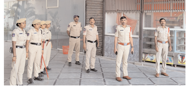
బాలాపూర్ మేజర్ న్యూస్( డిసెంబర్ 30): డిసెంబర్ 31 అనంతరం నూతన