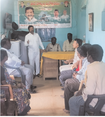
మేజర్ న్యూస్ (డిసెంబర్ 30) ప్రతి ఎారుడు తమ హక్కులతో పాటు భాద్యతను కూడా గుర్తించాలి సంగంలో కులమతాలకు అతీతంగా, అందరు కలిసి మెలసి జీవించాలి, ఒకరిపై మరోకరు ద్వేషించకూడదని కలిసి ఉంటేనే కలదు సుఖమని ఆయన అన్నారు. గ్రామాలలో జరిగే ఉత్సవాలకు అందరు గతంలో ఏలా కలిసి మెలసి జరుపుకునే వారో అలానే అందరు కలిపి మెలసి జరుపుకోవాలి ఆయన హామీ పలికారు. నేడుకొందరు యువకులు చెడువ్యసనాలకు అలవాటు పడి తమ నిండు జీవితాలను నాశనం చేసుకుంటున్నారని దేవుడిచ్చిన మానవ జన్మ మట్టి వస్త్రో రాదో కాని ఇప్పుడే