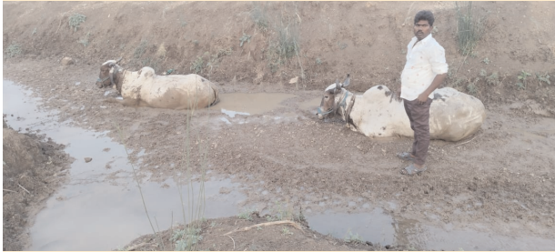
బురదలో ఇరుక్కున్న ఎడ్లు

● జేసీబీ సహాయంతో బయటికి తీసిన గ్రామస్థులు