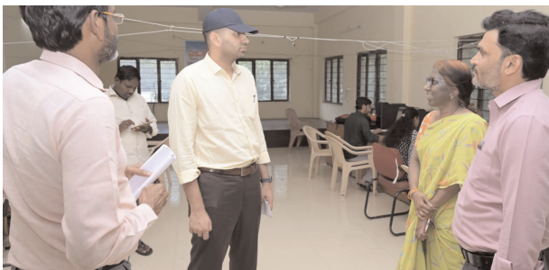
ఎంపీడీవో కార్యాలయంలో అధికారులతో మాట్లాడుతున్న జిల్లా కలెక్టర్ ప్రతీకృష్ణన్

కొడంగల్, డిసెంబరు 4 (మేజర్ న్యూస్): కులగణన సర్వే డాటా ఎంట్రీలో తప్పులు దొర్లకుండా త్వరగా పూర్తి చేయాలని జిల్లా కలెక్టర్ ప్రతీకృష్ణన్ అధికారులకు సూచించారు. బుధవారం కొడంగల్ పట్టణంలోని ఎంపీడీవో కార్యాలయంలో సర్వే డాటా ఎంట్రీ ప్రక్రియను పరిశీలించారు. తప్పులు దొర్లకుండా వివరాలను నమోదు చేయాలని అధికారులకు ఆదేశించారు. అంతకు ముందు కొడంగల్ వ్యవసాయ మార్కెట్ యార్డు ఆవరణలో హరే రామ, హరే కృష్ణ ఫౌండేషన్ ఆధ్వర్యంలో విద్యార్థులకు అల్పాహారం అందించేందుకు చేస్తున్న ఏర్పాట్లను కలెక్టర్ పరిశీలించారు. పనులను వేగవంతం చేసి ప్రారంభోత్సవానికి సిద్ధం చేయాలని అధికారులకు సూచించారు. కొడంగల్ నియోజకవర్గంలోని 8 మండలాల్లోని 312 ప్రభుత్వ పాఠశాలల్లో 27వేలకు పైగా విద్యార్థులకు