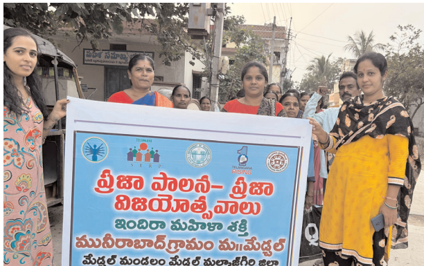
వేగాన్ని తెచ్చేలా పనిచేస్తున్నాయని అధికారులు పేర్కొన్నారు.

మహిళా శక్తి కార్యక్రమంలో ముఖ్య అంశాలు: 1. ప్రతి మండలానికి ఒక కాంటీన్ ఏర్పాటు. 2. బ్యాంక్ యార్డ్ పోస్ట్: 100 మందికి ఆర్థిక సహాయం. 3. మడర్ యూనిట్లు: 3 యూనిట్లు ఏర్పాటు. 4. ఎంటర్ప్రైజెస్: 1250 కొత్త వ్యాపార యూనిట్లు. 5. సభ్యత్వం: 1700 మంది మహిళలను కొత్త స్వయం సహాయ సంఘాలలో చేర్చడం. పునరావాసం కార్యక్రమాలు: మూసీ నిర్వాసిత ప్రాంతాల నుంచి ప్రత్యామ్నాయంగా గ్రామపంచాయతీ నందు పునరావాసం కల్పించారు. కొత్త సంఘాలలో చేర్చించి, మహిళా శక్తి పథకాలపై అవగాహన కల్పించారు. ప్రభుత్వం అందిస్తున్న పథకాలు మరియు బ్యాంకు లింకేజీల ద్వారా వారికి ఆర్థిక సహాయం అందేలా చర్యలు చేపట్టారు. మహిళా శక్తి ప్రధాన లక్ష్యాలు: గ్రామీణ మహిళల ఆర్థిక స్వావలంబనను పెంచడం. స్వయం సహాయ సంఘాల ద్వారా మహిళలను వ్యాపార రంగంలోకి తీసుకురావడం. మహిళా శక్తిని సమర్థవంతంగా వినియోగించి సమాజంలో కీలక మార్పులు తీసుకురావడం. ఈ కార్యక్రమాలు మహిళల ఆత్మవిశ్వాసాన్ని పెంచి, గ్రామీణాభివృద్ధి లో మరింత