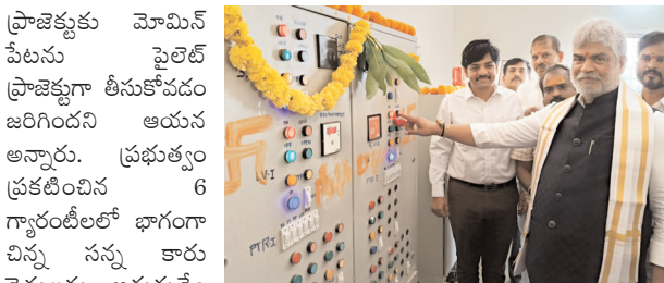
పవీష్టమన ప్రారంభిస్తున్న దృశ్యం

మోమినపేట్, మేజర్ న్యూస్ (డిసెంబర్ 05) మోమినపేట్ ప్రాంత అభివృద్ధి కృషి చేస్తానని శాసనసభ సభాపతి గడ్డం ప్రసాద్ కుమార్ అన్నారు. గురువారం మోమినపేట్ మండలంలో వివిధ అభివృద్ధి, సంక్షేమ కార్యక్రమాల్లో సభాపతి పాల్గొన్నారు. ఈ సందర్భంగా ఎన్యూఐ ప్రాంతంలో 52 లక్షల వ్యయంతో నిర్మించిన 33/36 వి విద్యుత్తు ఉపకేంద్రం, అదనపు పవర్ ట్రాన్స్ ఫార్మర్లను సభాపతి ప్రారంభించారు. మోమినపేట్ రైతు వేదికలో కళ్యాణ లక్ష్మి, పాదీ మూబారక్ పథకాల కింద 64 మంది లబ్ధిదారులకు 66 లక్షల 73 వేల రూపాయల చెక్కులను అదేవిధంగా 25 మందికి ముఖ్యమంత్రి సహాయ నిధి కింద 10 లక్షల 73 వేల చెక్కులను అయిన అందజేశారు. అదేవిధంగా చంద్రాయన్ పల్లి అంగన్నాడి, పూర్వ ప్రాథమిక పాఠశాల పిల్లలకు సభాపతి చేతుల మీదగా ఏకరూప దుస్తులను పంపిణీ చేశారు. మొరంగపల్లిలో 15వ ఆర్థిక సంఘం, డిఎంపిఐ లు సంయుక్తంగా 25 లక్షల 50 వేల రూపాయల వ్యయంతో నిర్మించిన ప్రాథమిక ఆరోగ్య ఉపకేంద్రం (పల్లె దవాఖాన) భవనాన్ని సభాపతి ప్రారంభించారు. ఈ సందర్భంగా ఆయన మాట్లాడుతూ... ప్రభుత్వం ఆర్థిక పరిస్థితిని అధిగమిస్తూనే ప్రజలకు ఇచ్చిన హామీలను ఒక్కొక్కటిగా నెరవేర్చడం జరుగుతుందన్నారు. 266 కోట్ల నిధులతో పంచాయతీరాజ్, ఆర్ అండ్ బి, పంట పొలాలకు వెళ్లే రోడ్ల నిర్మాణాలు చేపట్టేందుకు నిధులు మంజూరు చేయడం జరిగిందని ఆయన వెల్లడించారు. కల్కోండ ప్రాంతంలో పరిశ్రమల స్థాపనకు ఏర్పాటు చేయబోతున్నట్లు ఆయన తెలిపారు. పరిశ్రమలు ఏర్పాటుతో ప్రాంత అభివృద్ధిలో పాలు నిరుద్ధ్యంగా యువతకు ఉపాధి అవకాశాలు వస్తాయని ఆయన అన్నారు. కేంద్ర ప్రభుత్వం గృహ ఆవాసాలకు అందించే సోలార్