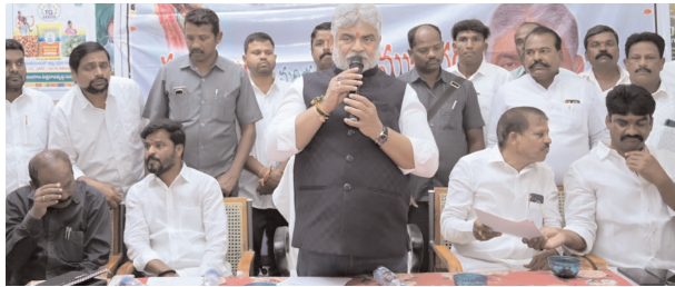
సమావేశంలో మాట్లాడుతున్న స్పీకర్ గడ్డం ప్రసాద్ కుమార్

మోమినపేట్, మేజర్ న్యూస్ (డిసెంబర్ 05) మోమినపేట్ ప్రాంత అభివృద్ధి కృషి చేస్తానని శాసనసభ సభాపతి గడ్డం ప్రసాద్ కుమార్ అన్నారు. గురువారం మోమినపేట్ మండలంలో వివిధ అభివృద్ధి, సంక్షేమ కార్యక్రమాల్లో సభాపతి పాల్గొన్నారు. ఈ సందర్భంగా ఎన్యూఐ ప్రాంతంలో 52 లక్షల వ్యయంతో నిర్మించిన 33/36 వి విద్యుత్తు ఉపకేంద్రం, అదనపు పవర్ ట్రాన్స్ ఫార్మర్లను సభాపతి ప్రారంభించారు. మోమినపేట్ రైతు వేదికలో కళ్యాణ లక్ష్మి, పాదీ మూబారక్ పథకాల కింద 64 మంది లబ్ధిదారులకు 66 లక్షల 73 వేల రూపాయల చెక్కులను అదేవిధంగా 25 మందికి ముఖ్యమంత్రి సహాయ నిధి కింద 10 లక్షల 73 వేల చెక్కులను అయిన అందజేశారు. అదేవిధంగా చంద్రాయన్ పల్లి అంగన్నాడి, పూర్వ ప్రాథమిక పాఠశాల పిల్లలకు సభాపతి చేతుల మీదగా ఏకరూప దుస్తులను పంపిణీ చేశారు. మొరంగపల్లిలో 15వ ఆర్థిక సంఘం, డిఎంపిఐ లు సంయుక్తంగా 25 లక్షల 50 వేల రూపాయల వ్యయంతో నిర్మించిన ప్రాథమిక ఆరోగ్య ఉపకేంద్రం (పల్లె దవాఖాన) భవనాన్ని సభాపతి ప్రారంభించారు. ఈ సందర్భంగా ఆయన మాట్లాడుతూ... ప్రభుత్వం ఆర్థిక పరిస్థితిని అధిగమిస్తూనే ప్రజలకు ఇచ్చిన హామీలను ఒక్కొక్కటిగా నెరవేర్చడం జరుగుతుందన్నారు. 266 కోట్ల నిధులతో పంచాయతీరాజ్, ఆర్ అండ్ బి, పంట పొలాలకు వెళ్లే రోడ్ల నిర్మాణాలు చేపట్టేందుకు నిధులు మంజూరు చేయడం జరిగిందని ఆయన వెల్లడించారు. కల్కోండ ప్రాంతంలో పరిశ్రమల స్థాపనకు ఏర్పాటు చేయబోతున్నట్లు ఆయన తెలిపారు. పరిశ్రమలు ఏర్పాటుతో ప్రాంత అభివృద్ధిలో పాలు నిరుద్ధ్యంగా యువతకు ఉపాధి అవకాశాలు వస్తాయని ఆయన అన్నారు. కేంద్ర ప్రభుత్వం గృహ ఆవాసాలకు అందించే సోలార్