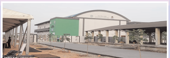
కొడంగల్ లో ప్రారంభానికి సిద్దమైన సెంట్రల్ డిజైన్ కమ్యూనిటీ కిచ్

కొడంగల్, డిసెంబరు 5 (మేజర్ న్యూస్): ముఖ్యమంత్రి రేవంత్ రెడ్డి సొంత నియోజకవర్గం కొడంగల్ రూపు రేఖలు మారిపోతున్నాయా..? వివరాలు 3లో