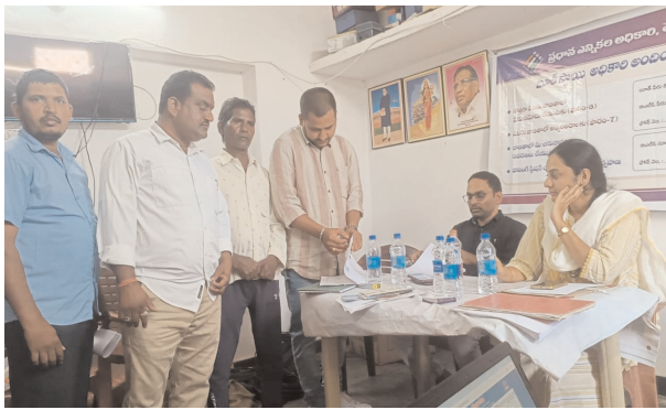
ఫించన్న పై విచారిస్తున్న డీఆర్ఓపి అధికారి నర్సింలు

● తాండూరు మండల అంతారం, బెల్కూటార్లో తనిఖీ ● ఎంపీడిఓ కార్యాలయంలో పేరుకుపోయిన