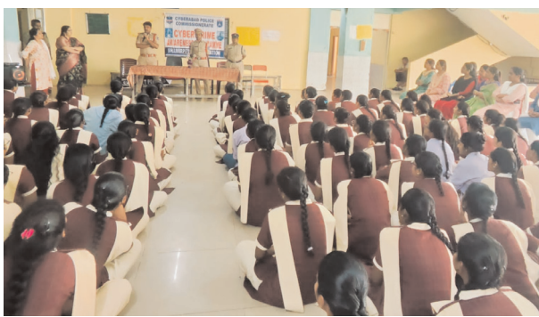
అవగాహన కార్యక్రమంలో పాల్గొన్న విద్యార్థులు

తీసుకోవాలి. సైబర్, డ్రగ్స్ టోల్ ఫ్రీ నంబర్లు: 1. డ్రగ్స్ సమాచారం కోసం: 18005996969 2. సైబర్ క్రైమ్ ఫిర్యాదుల కోసం: 1930 ఈ కార్యక్రమం విద్యార్థులకు చైతన్యాన్ని పెంచి, భవిష్యత్తులో నేరాల నుంచి దూరంగా ఉండేలా చేయడమే లక్ష్యంగా నుంచి దూరంగా ఉండేలా చేయడమే లక్ష్యంగా సమాచారాన్ని అందించి, సమాజంలో డ్రగ్స్, సైబర్ నేరాలను నివారించడంలో భాగస్వాములు కావాలని పోలీసులు సూచించారు.