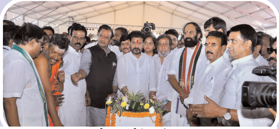
అభివృద్ధి పనుల ప్రారంభోత్సవంలో సీఎం రేవంత్ రెడ్డి, మంత్రులు (ఫైల్)

కొడంగల్, డిసెంబరు 5 (మేజర్ న్యూస్): ముఖ్యమంత్రి రేవంత్ రెడ్డి సొంత నియోజకవర్గం కొడంగల్ రూపు రేఖలు మారిపోతున్నాయా..? వివరాలు 3లో