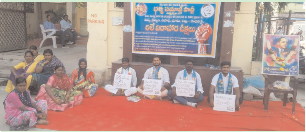
మేడిపల్లి తహసీల్ కార్యాలయం ముందు డిఎస్పీ రిలే నిరాహార దీక్షలు.