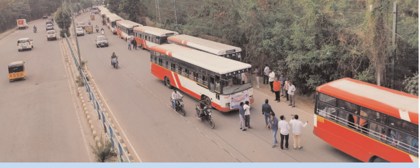
తెలంగాణ తల్లి విగ్రహ విష్కరణకు తరలివెళ్లిన మహిళలు

గండిపేట్, మేజర్ న్యూస్ (డిసెంబర్ 09) : ప్రజాపాలన విజయోత్సవాలలో భాగంగా తెలంగాణ తల్లి విగ్రహ విష్కరణ కార్యక్రమాన్ని విజయవంతం చేసేందుకు బండ్లగూడ జాగీర మున్సిపల్ కార్పొరేషన్ నుంచి సుమారు వెయ్యి మంది మహిళలు తరలివెళ్లారు. ఈ మేరకు బీజేఎంసీ నుంచి 20 బస్సులను కార్పొరేషన్ నుంచి తరలించారు. అందులో భాగంగా కార్పొరేషన్ శరత్ చంద్ర జెండా ఊపి బస్సులను ప్రారంభించారు. అనంతరం కమిషనర్ మాట్లాడుతూ.. ప్రభుత్వ ఆదేశాల మేరకు తెలంగాణ తల్లి విగ్రహ విష్కరణ కార్యక్రమానికి బీజేఎంసీ నుంచి పెద్ద ఎత్తున మహిళలు తరలివెళ్లారు. ఈ మేరకు 20 బస్సులను ఏర్పాటు చేసినట్లు వివరించారు. ఈ కార్యక్రమంలో అధికారులు, మహిళలు తదితరులు పాల్గొన్నారు.