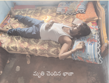
మృతి చెందిన ఖాజా

యాలాల్ మేజర్ న్యూస్ (డిసెంబర్ 09): మండలం పరిధిలోని తాండూరు ఇందిరమ్మ కాలనీలో నిత్యం మద్యం సేవించి వచ్చి వేధిస్తున్న భర్తను భార్య హతమార్చింది. ఈ ఘటన సోమవారం అర్ధరాత్రి వికారాబాద్ జిల్లా