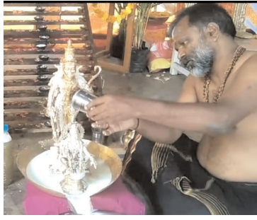
అయ్యప్పస్వామికి గండాభిషేకం చేస్తున్న దృశ్యం.