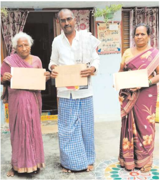
గుమ్మలకృష్ణారం, డిసెంబర్ 18, మేజర్స్ న్యూస్