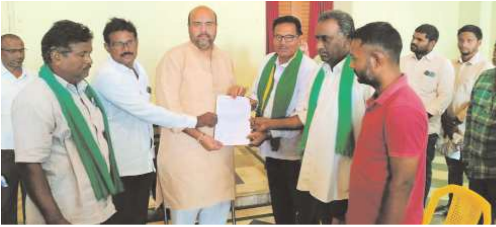
బోధిల్లి, డిసెంబర్ 18, మేజర్స్ న్యూస్

ఎమ్మెల్యే బేజనాయనకు వినతి పత్రం అందజేస్తున్న పాల ఉత్పత్తి రైతులు