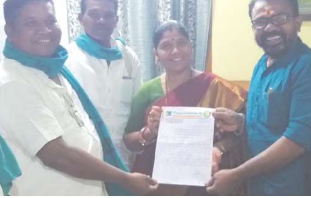
గుమ్మలకృష్ణారం, డిసెంబర్ 18, మేజర్స్ న్యూస్

- ఎమ్మెల్యేకు వినతి పత్రం అందజేసిన గ్రామస్థులు, నాయకులు