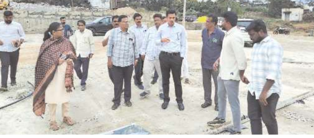
మొక్కపాడు, డిసెంబర్ 18, మేజర్స్ న్యూస్