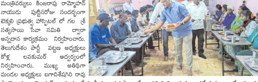
బెత్తల, డిసెంబర్ 18, మేజర్స్ న్యూస్

కేంద్ర పౌర విహాన శాఖ మంత్రివర్గము కిందరావు రామ్మోహన్ నాయుడు పుట్టినరోజు సందర్భంగా బెత్తల ప్రభుత్వ హాస్పిటల్ లో గల శ్రీ సత్యసాయి సేవా సమితి ద్వారా అన్నదాన కార్యక్రమం నిర్వహించారు.