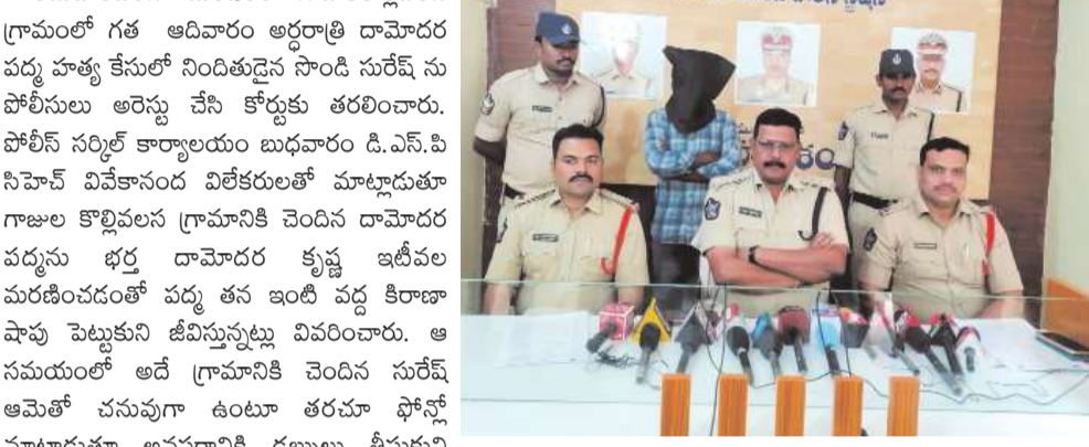
అమరాలపాల, డిసెంబర్ 18, మేజర్స్ న్యూస్