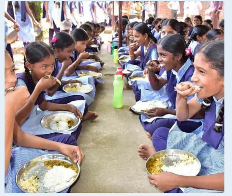
విద్యార్థులకు వుడ్ పాయిజన్.. సర్కార్ కీలక ఆదేశాలు