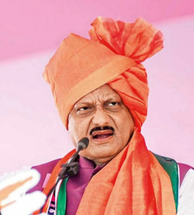
నాలిమన్ పాయింట్ వద్ద ఉన్న నిర్మల్ టవర్ తో పాటు మొత్తం ఐదు ప్రాజెక్టులను ఐటీ శాఖకు అటాచ్ చేసింది. వాటిలో నిర్మల్ టవర్ తోపాటు సతారాలోని ఝగర్

డిప్యూటీ సీఎంగా ప్రమాణ స్వీకారం చేసిన మరుసటి రోజే అజిత్ పవార్ కు భారీ ఊరట లభించింది. గతంలో సీజ్ చేసిన కొట్టు విలువైన బినామీ ఆస్తులను ఆదాయపన్ను శాఖ తాజాగా క్లియర్ చేసింది. అజిత్ పవార్, అతని కుటుంబ సభ్యులు బినామీ ఆస్తులు కలిగి ఉన్నారనే ఆరోపణలను ఆదాయ పన్ను శాఖ (ఇన్ కమ్ ట్యాక్స్ డిపార్ట్ మెంట్)కు చెందిన బినామీ ఆస్తుల లావాదేవీల నిరోధక అప్సీలెట్ ట్రిబ్యునల్ కొట్టిపారేసింది. ఈ నేపథ్యంలో ఆయనకు ఊరట కల్పించింది. కాగా, బినామీ ఆస్తులు కలిగి ఉన్నారనే ఆరోపణలపై 2021 అక్టోబర్ 7న అజిత్ పవార్ కు చెందిన సుమారు 1000 కోట్ల ఆస్తులను ఆదాయపన్ను శాఖ సీజ్ చేసిన విషయం తెలిసిందే. ముంబైలోని