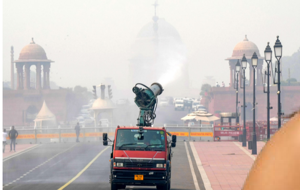
తక్కువ నాణ్యత అని, 301 నుంచి 400 వరకు ఉంటే చాలా పేలవమైనదని, 401 నుంచి 500 ఉంటే ప్రమాదకరస్థాయిగా పరిగణిస్తారు.

దేశ రాజధాని ఢిల్లీలో వాయు కాలుష్యం మళ్లీ సాధారణ స్థితికి చేరింది. గత వారం కాస్త మెరుగుపడిన వాయు నాణ్యత.. ఈ వారం అధ్యాన స్థితికి చేరింది. కేంద్ర కాలుష్య నియంత్రణ మండలి డేటా ప్రకారం.. మంగళవారం ఉదయం 8 గంటల సమయంలో ఎయిర్ క్వాలిటీ ఇండెక్స్ 224గా నమోదైంది. ఐటీవో ప్రాంతంలో ఏకంగా లెవల్స్ 254గా, అలీపూర్ లో 214గా, ఛాందిని చౌక్ వద్ద 216, జబహర్ లాల్ నెహ్రూ స్టేడియం ప్రాంతంలో 203గా గాలి నాణ్యత నమోదైంది. కొన్ని ఎయిర్ మానిటరింగ్ స్టేషన్లలో మోడరేట్ కేటగిరీలో గాలి నాణ్యత నమోదైంది. డీటీయూలో 169, లోఫ్ ఠోడ్డులో 123, సబ్ఘగర్ లో 142గా ఏకంగా ఉంది. ఇక నిన్న ఢిల్లీలో గాలి నాణ్యత 231గా నమోదైన విషయం తెలిసింది. గత వారం ఏకంగా లెవల్స్ 200 లోపే నమోదయ్యాయి. గాలి నాణ్యత సున్నా నుంచి 50 మధ్య ఉంటే బాగా ఉన్నట్లు అర్థం. 51 నుంచి 100 వరకు ఉంటే సంతృప్తికరమైనదని, 101 నుంచి 200 వరకు ఉంటే మితమైన నాణ్యత, 201 నుంచి 300 ఉంటే