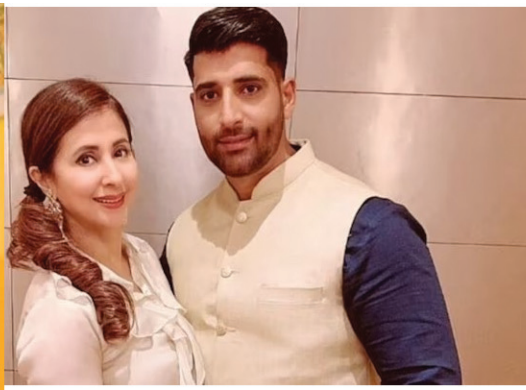
వివాహమై 29 ఏళ్లు. వీరిద్దరికీ