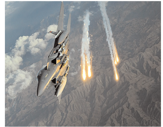
హెబ్రూల్లో ఇజ్రాయెల్-హెబ్రూల్లల మధ్య కాల్పుల విరమణ అవుతోకి వచ్చిన నేటికీ ఉద్బంధనలు చోటుచేసుకుంటున్నాయి. తాజాగా ఇరాక్ వైపు

నుంచి ఇజ్రాయెల్లోకి రెండు డ్రోన్లు దూసుకొచ్చినట్లు అధికారులు పేర్కొన్నారు. మధ్యధరా సముద్రంలోనే నేటి మిస్సైల్ బోటు సాయంతో వాటిని తమ మిలిటరీ దళాలు నేలకూర్చాయని తెలిపారు. అవి 'కూర్చు' నుంచే వచ్చాయని, ఇరాక్ వాటిని ప్రయోగించింది అని చెప్పడానికి ఆధారాలు లేవని వివరించారు. కాగా డ్రోన్లు దూసుకొస్తున్న సమయంలో ఎలాంటి సైరస్ మోగలేదని వెల్లడించారు. ఇటీవల ఇరాన్ నుంచి ఇజ్రాయెల్ వైపు దూసుకొచ్చిన మరో అనుమానిక డ్రోన్లు ఇజ్రాయెల్ వైమానిక దళం కూల్చివేసినట్లు వెల్లడించారు. కాగా ఇజ్రాయెల్-హెబ్రూల్లల మధ్య యుద్ధం నేపథ్యంలో సురక్షిత ప్రాంతాలకు వెళ్లిన రెటనాన్ సరిహద్దు ప్రాంత ప్రజలు కాల్పుల విరమణ ఒప్పందం అనంతరం తిరిగి తమ ప్రాంతాలకు ప్రయాణమయ్యారు. దీనిపై ఇజ్రాయెల్ డిఫెన్స్ ఫోర్స్ స్పందిస్తూ రెటనాన్ దక్షిణభాగంలోని సరిహద్దు ప్రాంత ప్రజలకు హెచ్చరికలు చేసింది. సురక్షిత ప్రాంతాలకు వెళ్లినవారు కాల్పుల విరమణకు సంబంధించిన తదుపరి నివేదిక వచ్చే వరకు తమ సొంత గ్రామాలు తిరిగిరావద్దని పేర్కొంది. కాల్పుల విరమణ ఒప్పందం ప్రకారం, బందీలను ఈ గ్రామాల నుండి వైదొలగడానికి 60 రోజుల సమయం ఉంది.