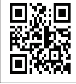
సూర్య ఈ - పేపర్