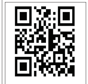
సూర్య ఈ - పేపర్