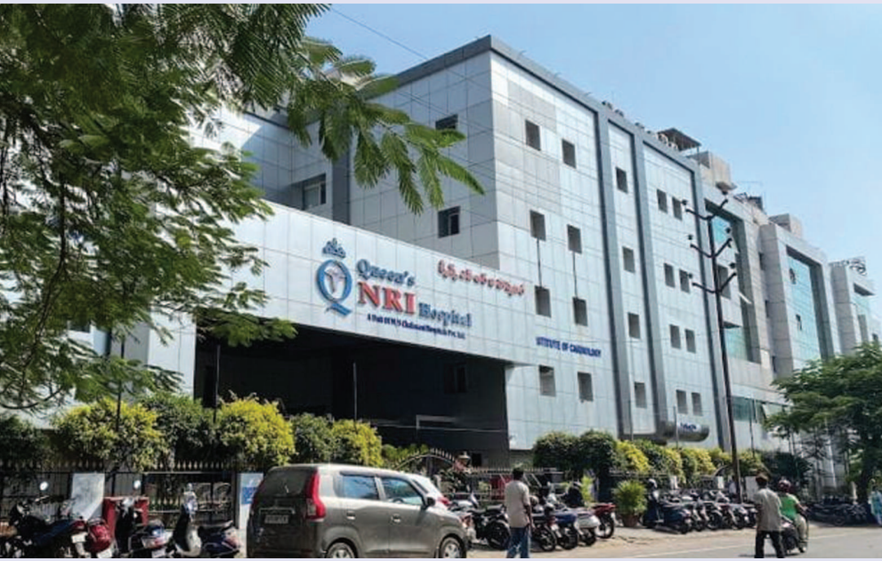
విశాఖపట్నం, డిసెంబర్ 29, మేజర్స్ న్యూస్ :