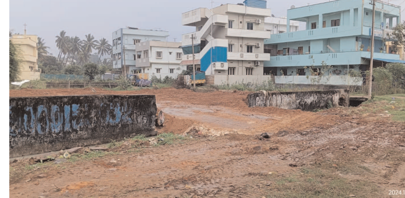
పరవాడ, డిసెంబర్ 29, మేజర్స్ న్యూస్ :

గెర్లె రెవెన్యూ పంచాయతీ అధికారులు పట్టణంకోవడందేదేని అంటూ జిల్లా కలెక్టర్లు స్థానిక పంచాయతీ కార్యాలయానికి కూక వేటు దూరంలో గెడ్డ వాగు, పంచాయతీ కాలన ఆక్రమించి ఒక రియాలిటీ తన భూములకు రహదారి నిర్మిస్తే అధికారులు చోద్యం చూస్తున్న సంఘటన పరవాడలో చోటుచేసుకుంది. ఈ ఆక్రమణపై స్థానికులు అధికారులకు ఫిర్యాదు చేసిన చర్యలు శూన్యం. గతంలో మురుగు దొడ్లుగా ఉపయోగించిన స్థలాన్ని అక్కడ నిర్మించిన ప్రహారీ గోడను తొలగించి ఒక రియాలిటీ తన భూములకు బహిరంగంగా రోడ్డు నిర్మాణం చేపట్టారు. గెడ్డ వాగులో పంచాయతీ మురుగు నీరు పోవడానికి కాలన నిర్మిస్తే దానిపైనే కూడా గ్రావెల్ వేసి తన భూములోనికి రియాలిటీ రహదారి వేసుకున్నారు. ఇంత జరిగినా ఉన్నారని అవవాడును ఉన్న వారు మాత్రం తమకు పట్టణం వ్యవహరిస్తున్నారు. ఇప్పటికైనా జిల్లా కలెక్టర్ పరవాడలో జరుగుతున్న ప్రభుత్వ భూములు గెడ్డ వాగులో ఆక్రమణపై ప్రత్యేక దర్యాప్తు నిర్వహించి బాధ్యులైన అధికారులపై చర్యలు తీసుకుని ప్రభుత్వ భూములు గెడ్డ వాగులు రక్షించాలని పలువురు ప్రజలు కోరుతున్నారు.