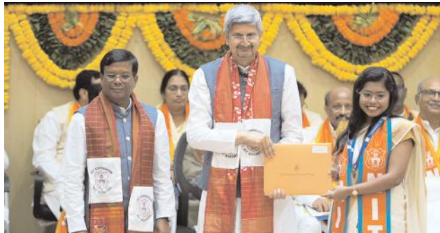
డిఆర్ డిఓ దేశ వ్యాప్తంగా 15 డిఆర్ డిఓ అకడమిక్ సెంటర్స్ ఆఫ్ ఎక్సలెన్స్ ని ప్రారంభించామని తెలిపారు. డిఆర్ డిఓ కి ఉజ్వలంగా భవిష్యత్తు ఉందని చెప్పారు. భారత దేశాన్ని అభివృద్ధి చెందిన దేశంగా మార్చడంలో మీ తరం ముందుంటుందని తెలిపారు. గ్రాడ్యుయేట్ లను, పతక విజేతలను ఆయన అభినందించారు. కార్యక్రమంలో నీట్ ప్రాఫెసర్లు, విద్యార్థులు పాల్గొన్నారు.