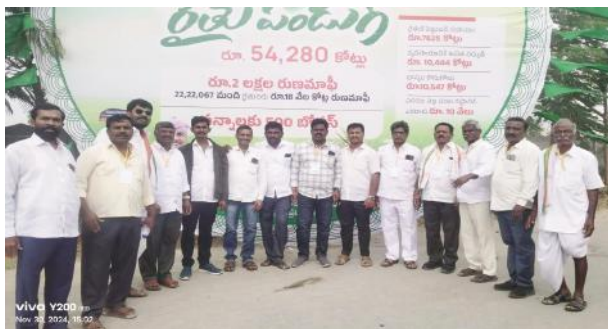
దేవరపల్లె నవంబర్ 30 (మేజర్ న్యూస్ సూర్య):పాలకూర్తి ఎమ్మెల్యే