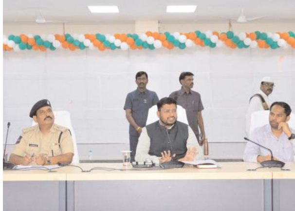
చీఫ్ సూపరింటెండెంట్ లు, ఫ్లయింగ్ స్టాఫ్ లు, రూట్ అధికారులు, అబ్జర్వర్ లు, ఇండెంటిఫికేషన్ అధికారులు, సంబంధిత శాఖల జిల్లా అధికారులను ఆదేశించారు.

చర్యల నడుమ తప్పనిసరిగా ఎస్కార్డ్ తో ప్రభుత్వ వాహనాల్లో పరీక్ష కేంద్రాలకు తరలింపాలని, ఎటువంటి పొరపాట్లకు తావులేకుండా సమయానుకూలంగా వ్యవహరించాలన్నారు. ఇన్వెస్టిగేటర్ లతో సమావేశాలను ఏర్పాటు చేయాలని, సింటర్ లలో సీసీ కెమెరాల పని తీరును సరిచూసుకోవాలని, అభ్యర్థుల హాల్ టికెట్, గుర్తింపు పొందిన ప్రభుత్వ ఐడీ కార్డును సరిగా చూడాలని, నిర్దేశించిన రూట్ లలో మాత్రమే ప్రశ్న పత్రాలు, ఓఎంఆర్ పత్రాలను తీసుకొని వెళ్ళాలని, పోలీసు బందోబస్తు పరీక్షా కేంద్రాల నిర్వహించాలని